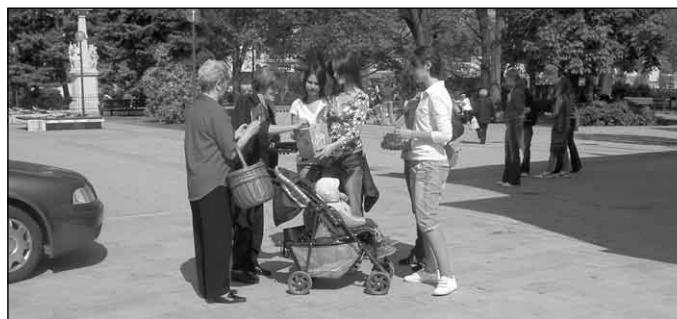
Felvételünk a Milan Rastislav Štefánik Gimnázium diákjait örökítette meg adománygyűjtés közben