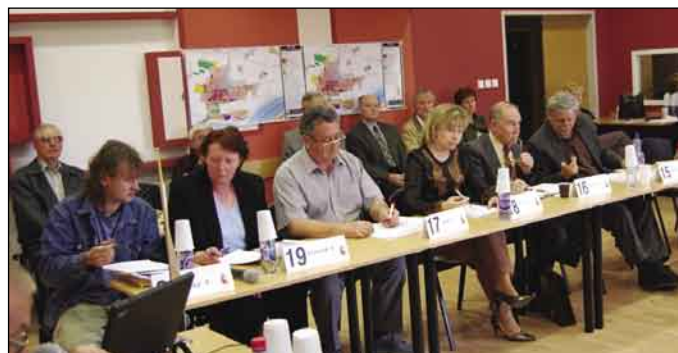
Časť poslancov mestskej samosprávy

propagačných zariadeniach, ako aj nariadenie číslo 2/2007 o prevoze vlastníctva bytov a nebytových priestorov v bytových domoch vo vlastníctve mesta. Pod číslom 3/2007 poslanci schválili nariadenie o Zásadách hospodárenia a nakladania s majetkom mesta. Po schválení predaja a prenájmu niekoľkých pozemkov poslanci schválili finančné čiastky, ktoré navrhla komisia športu a mládeže, komisia kultúry a cirkví, ako aj školská komisia. Medzi športové kluby boli rozdelené financie vo výške milión korún, medzi mládežníckymi organizáciami zasa 100-tisíc korún. Kultúrne organizácie získali 550-tisíc korún, cirkevné zbory zasa 120-tisíc korún. Medzi školami bolo rozdelených 852-tisíc korún. Na zasadnutí bol za predsedu komisie kultúry a cirk-