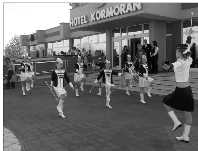
Na slávnostnom otvorení parku pri čilistovskom hoteli Kormoran 14. apríla s veľkým úspechom vystúpili mažoretky zo Základnej školy na Kláštornej ulici