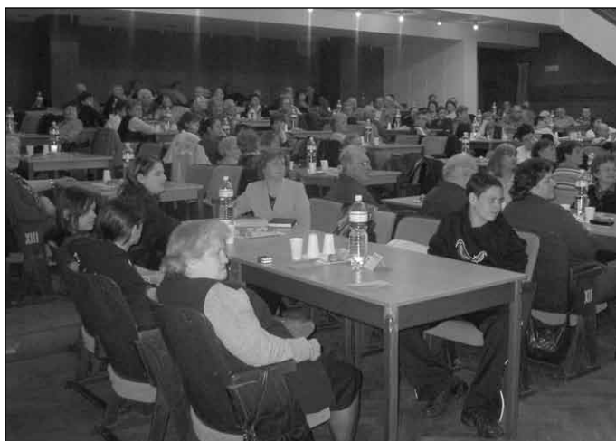
Účastníci výročnej schôdze

Dozorná rada Spotrebného družstva Jednota v Šamoríne upozorňuje majiteľov nákupných kariet Jednota, aby si vyplatenie 1,5-percentného príspevku za nákup v roku 2006 uplatnili v danej predajni Jednota najneskôr do 31. mája 2007.