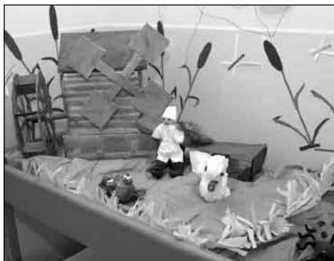
Výstava očarila návštevníkov