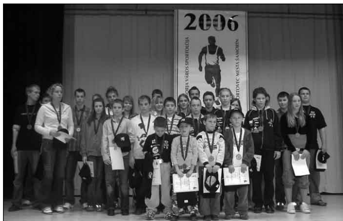
Športovci, ktorí boli ocenení za svoje vlnajšie vynikajúce výsledky

29. marca sa vo veľkej sále mestského kultúrneho strediska už po štvrtý raz stretli športovci a tréneri mestských športových klubov, ako aj rodičia a priatelia. Cieľom už tradičného športového galaprogramu je oceniť mladých športovcov, ktorí v minulom roku dosiahli vynikajúce výsledky, aktívnych trénerov a predsedov klubov.