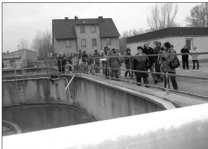
Účastníci si v Hainburgu pozreli aj čističku odpadových vôd

Hainburg, ktoré má bohatú históriu, na poli cestovného ruchu. Na jednej strane bolo cieľom oboznámiť sa s tým, ako obyvatelia mesta dokážu predať to, čo majú. Ich historické pamiatky vidíme aj my, Šamorínčania, keď cez mesto prechádzame. Na druhej strane sme do programu pridali aj problematiku nakladania s odpadom, lebo turista sa cíti zle v meste plnom smetí. Na tomto poli sa veru máme čo od Rakúšanov učiť. Súčasťou programu je aj to, že v Šamoríne sa teraz pripravuje turistický informačný systém, ktorý sme pri vypracovaní strategického plánu Šamorína pokladali za dôležitý, nakoľko jeho potreba vyplynula z rozhovorov s poskytovateľmi