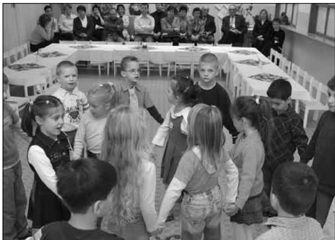
Program detí si so záujmom pozreli aj hostia