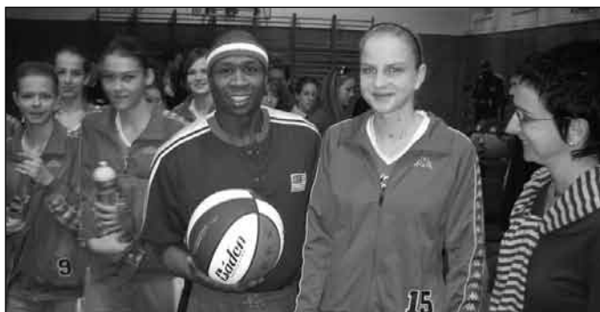
Autorka článku s hráčom z Harlemu Globetrotters

Po ukončení miniturnaja sme sa vybrali s mojimi spoluhráčkami na obed. Tu sme sa dozvedeli, že máme možnosť ísť večer na bratislavské Pasienčky na vystúpenie americkej skupiny basketbalistov HARLEM GLOBETROTTERS!!! To bolo prekvapenie, ktoré bolo pre nás pripravené za úspech v tohtoročnej sezóne. Ale to nebolo všetko, pred vystúpením amerických basketbalistov sme mali hrať ako „predskokani“ s bratislavským družstvom dievčat. Neverili sme vlastným ušiam, my budeme hrať pred slávnymi Harlemákmi, o takejto pocte sa nám mnohým ani nesnívalo. Od tejto chvíle, ako nám oznámili program na večer, sme mnohé ani nevníмали, ako sme sa z Nitry premiestnili do Bratislavy priamo