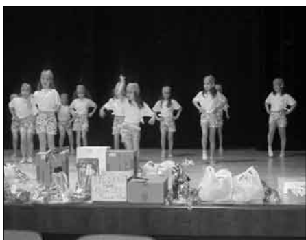
Žiaci Základnej školy Mateja Korvína pozdravili prítomných tancom