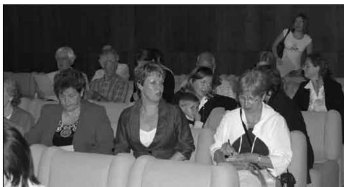
Na koncerte v základnej umeleckej škole