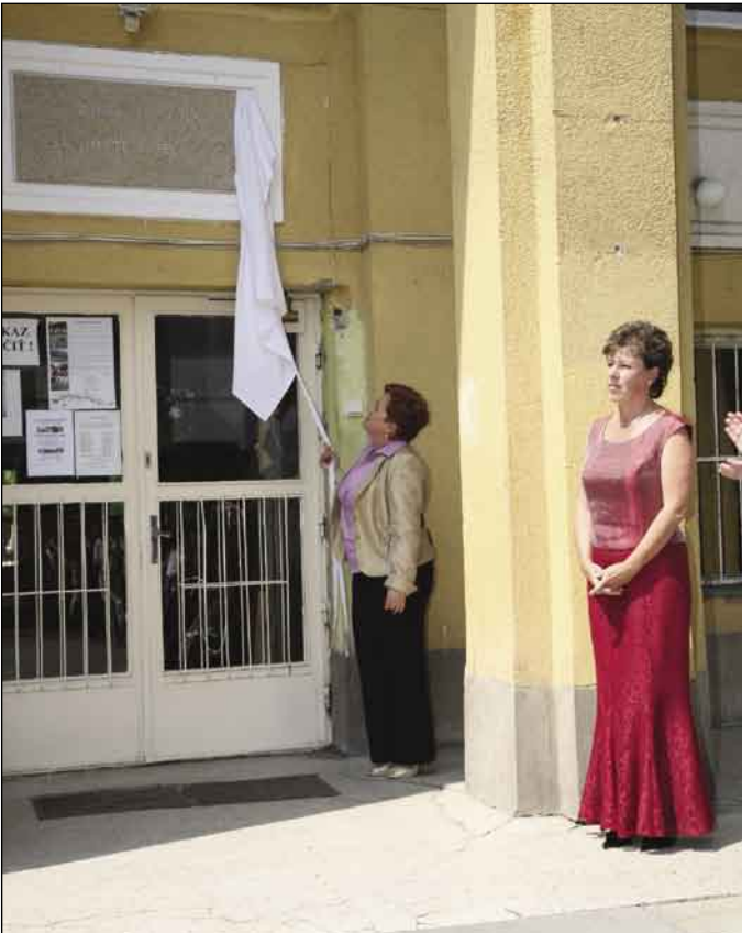
Ďakujeme ZŠ Kláštorňá 4 – veľa šťastia ZŠ Mateja Bela! Odhalenie tabule s názvom Základná škola Mateja Bela. Viacej na strane 7