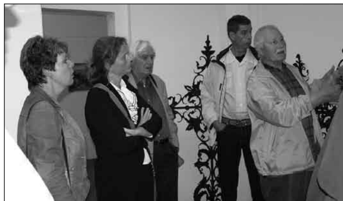
V Mestskom vlastivednom dome