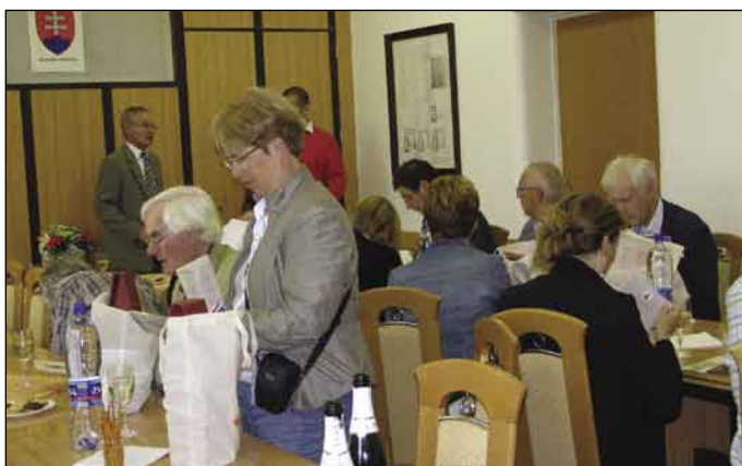
Na mestskom úrade

Upozorňujeme milých čitateľov, že letné číslo našich novín vyjde trochu neskôr. Na obvyklých miestach ho nájdete okolo 23. júla, ako aj na internetovej stránke www.samorin.sk