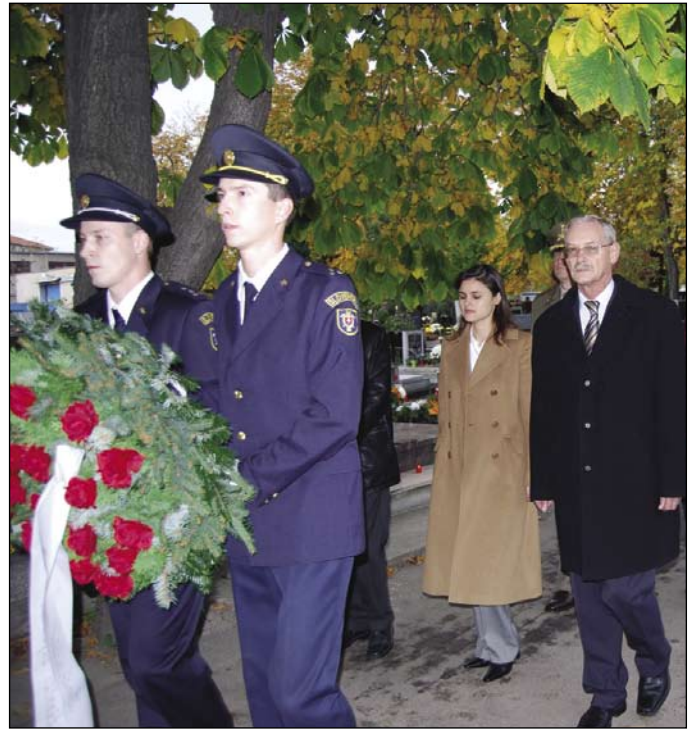
1. novembra, vo sviatok Všetkých svätých, opäť navštívila Šamorín delegácia talianskeho veľvyslanectva, aby v sprievode vedenia nášho mesta na cintoríne položila vence k pamätníku talianskych a ruských vojakov