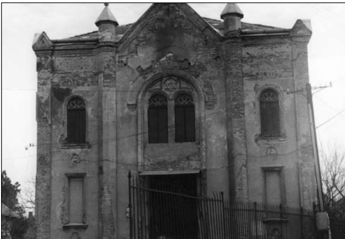
Synagóga pred renováciou