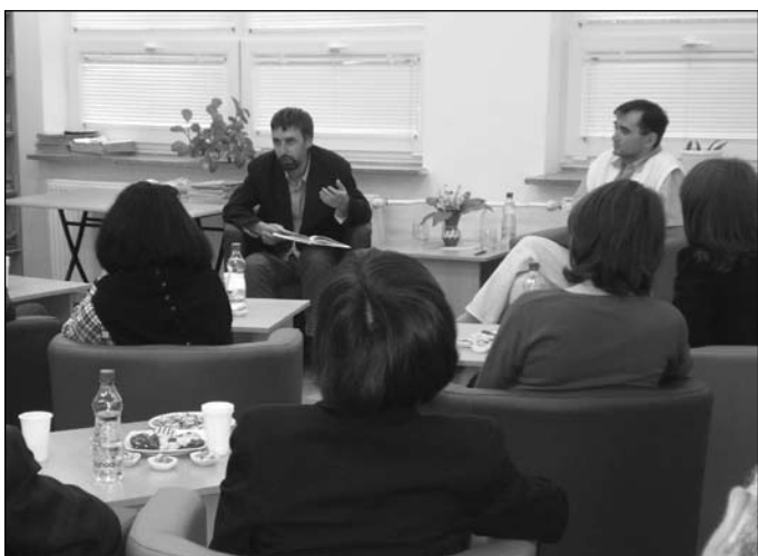
Simon Attila: Telepesek és telepés falvak Dél-Szlovákiában a két világháború között