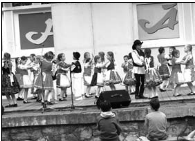
A Csali néptáncgyűttes, ahogy az már lenni szokott, nagy sikert aratott fellépésével az idei majálison is a Pomléban