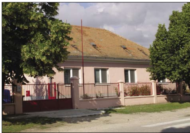
A tejfalui óvoda és iskola étkezdéjének felújított épülete

zése szakértők segítségével folyamatban van, viszont el kell mondanunk, hogy a pályázati anyagot ez év végéig nem tudjuk megfelelő