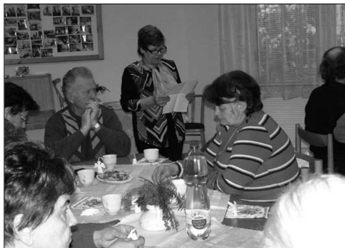
ZO Jednoty dôchodcov na Slovensku