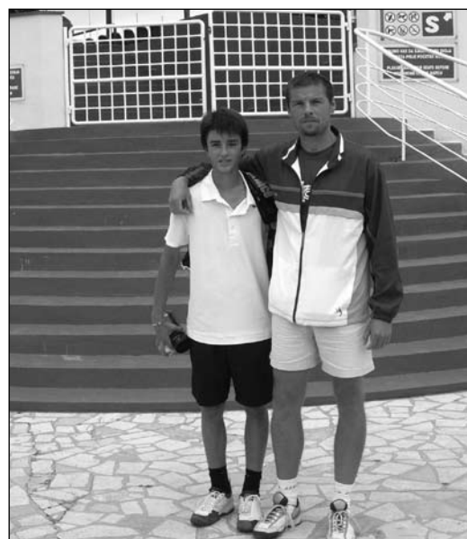
Na turnaji v Umagu s trénerom

sponzorom, ktorí Olivera vo svojom športe podporujú: NIKE International, PRINCE International, PEUGEOT, FITLINE International, TRANSPETROL, Stavebniny Kvetoslavov.