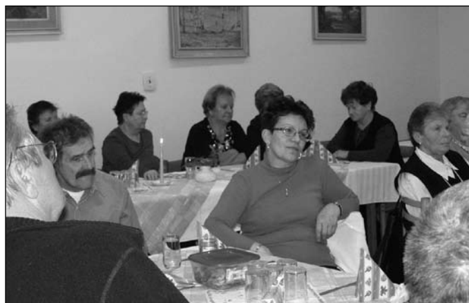
ZO ZCPCH a SZTP

Takéto a podobné stretnutia sú, najmä v období adventu, potrebné, lebo mnohým nie je dopriate, aby sviatky lásky strávili v rodin-