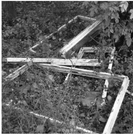
Becsked – do zberného dvora mohlo byť bližšie

Programom cezhraničnej spolupráce Maďarská republika – Slovenská republika 2007 – 2013. V rámci spolupráce družobných miest totiž mesto v spolupráci so Šamorínskou regionálnou rozvojovou agentúrou