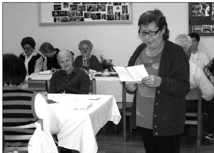
Klub dôchodcov Samária

ých miestnostiach v spoločnosti svojich druhov, medzi ktorými zabudnú na svoj smútok, trápenie a samotu.