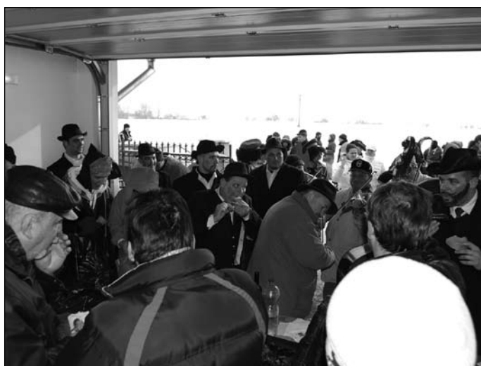
Tejfalun a dőreket szívólyesen fogadták a Termék Kft.-ben is