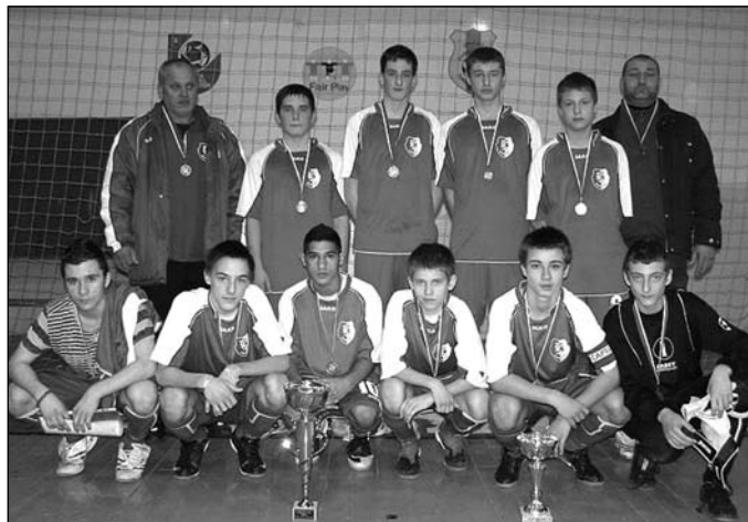
A somorjai STK veretlen legénysége