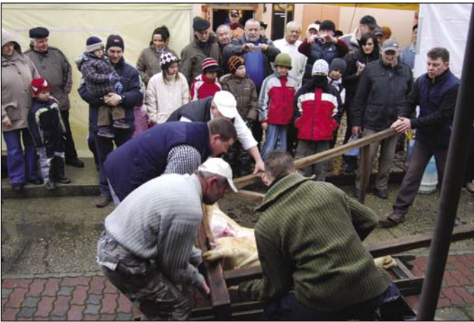
Február 20-án rendezték Tejfalun az első disznótoros ünnepséget, amely a fiatalok számára igazi szenzáció, hiszen manapság az ember nem minden nap lát ilyet. A szervezők szeretnének hagyományt teremteni