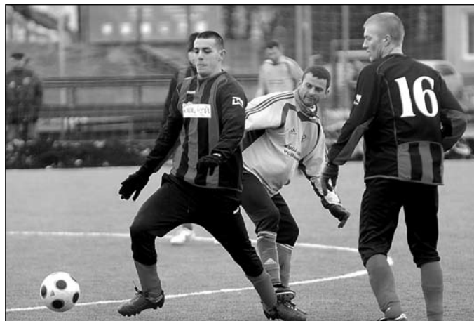
A somorjai csapat a dunaszerdahelyi műfüves pályán 2:1-re győzte le a csallóközkürtieket

A somorjaiak nem okoztak csalódást, az STK képviselői ugyanis, a fiatalabb és az idősebb diákok egyaránt a negyedik helyen zárták a megmérettetést.