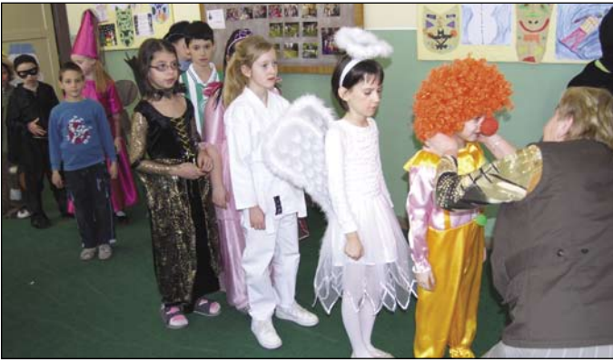
A tejfalui alapiskola február 12-én tartotta idei álarcosbálját. Írásunk a 4. oldalon