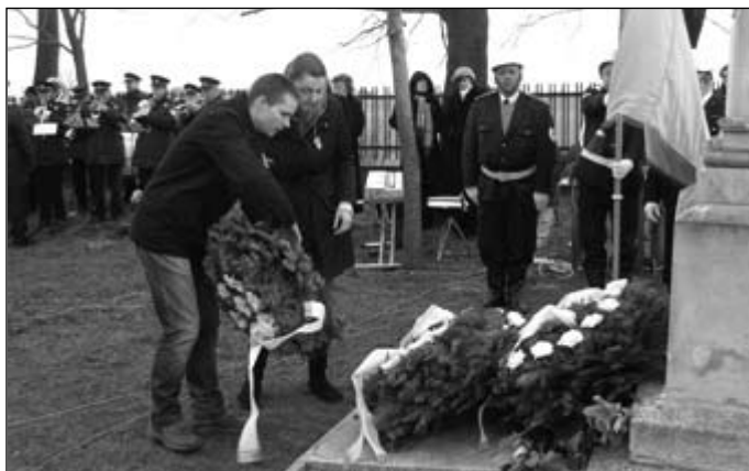
Madách Imre Gimnázium

Az 1848–49-es szabadságharcban elesett hősök emlékére állított pipagyújtói emlékműnél a tűzoltók fúvószenekarának közreműködése mellett számos szer-