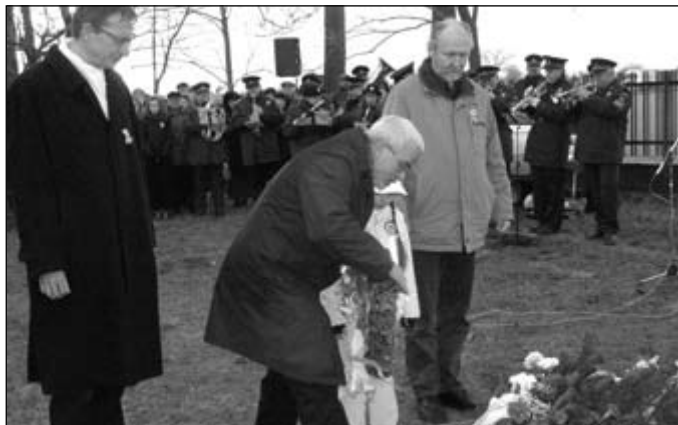
Fórum Kisebbségkutató Intézet

ság. Azt gondolom, a szabadság folyamat, folyamat, amelyért tenni kell, s amelyet csak akkor tudunk megtartani, ha mindig szem előtt tartjuk azt, hogy a szabadságért való tevés és a szabadságért való harc a szívnek és az észnek az ötvözetéből alakul ki. Tehát ha meg akarjuk őrizni szabadságunkat, akkor Petőfiként és Kossuthként kell gondolkodnunk és tennünk, de Széchenyiként és Deák-ként is. Ha ily módon meg tudjuk szervezni magunkat, akár szlovákiai magyarokként is, akkor fényes jövő áll előttünk.