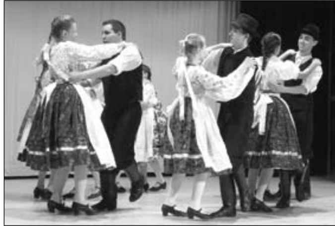
A kultúrnap keretén belül a Csali Ifjúsági Csoport is fellépett