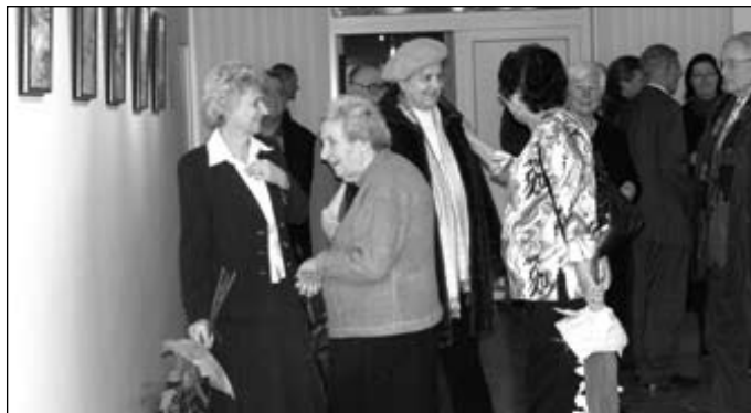
A tárlatnyitó résztvevői

éjt nappalá téve ült a vászon előtt, készítette újabb és újabb alkotásait, örökölte meg a csodálatos somorjai tájat, hogy egy újabb tárlattal ismét örömet szerezzen a város lakóinak.