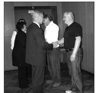
A Jánkský-émlékérem viselőinek köszönet jár a véradásért

A Vöröskereszt évzáró taggyűlését a szeretet, az egymás iránti tisztelet légköre hatotta át. A családias légkörhöz hozzájárult az is, hogy a vezetőség nem feledkezett meg a tavalyi kerek születésnapjukat ünneplőkről,