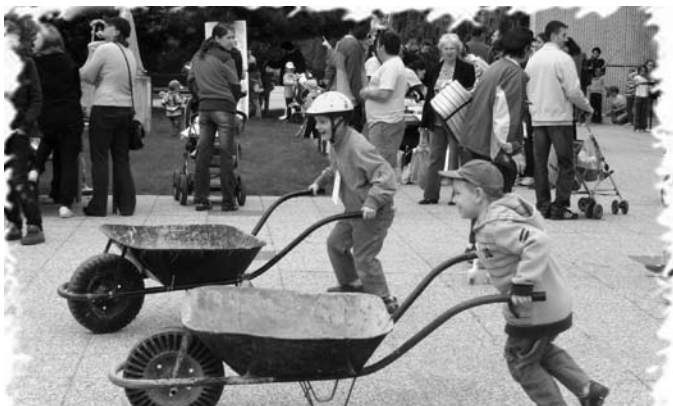
Fúriková dráha mala pre deti veľký úspech