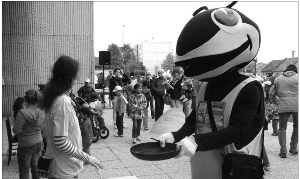
Maskot Mravec súťaží v prehode palacínok