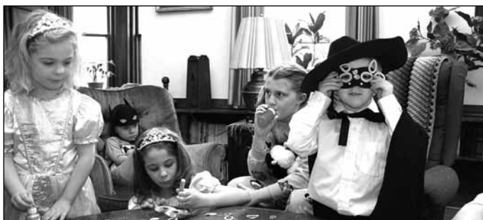
Ilustračná snímka (internet)