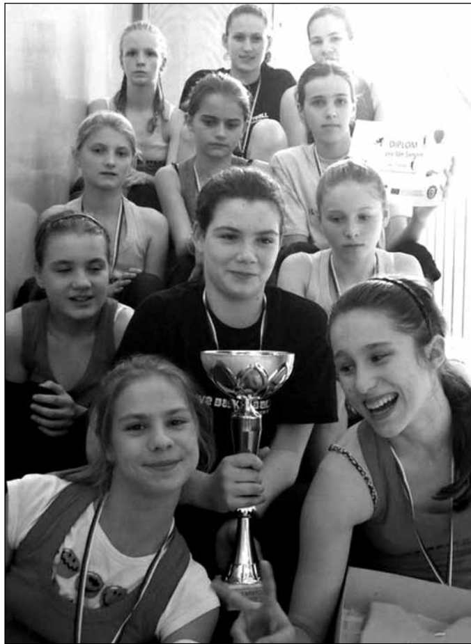
Basketbalistky v Litoměřici

najmenšími. Staršie žiačky obsadili v základnej časti tesne tretie miesto, takže k účasti v celoslovenskom finále im chýbalo jedno víťazstvo... O najradostnejšie chvíle sa postarali v uplynulej sezóne mladšie žiačky (ročník 1998-99). Bravúrnym spôsobom vyhrali základnú časť západoslovenskej skupiny, keď v rade dokázali zvíťaziť 12-krát. Úctihodným výkonom porazili aj druhú Nitru v pomere 61:47 a 84:36, a svoje ďalšie súperky doslo-