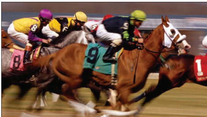
Ilustračná fotka