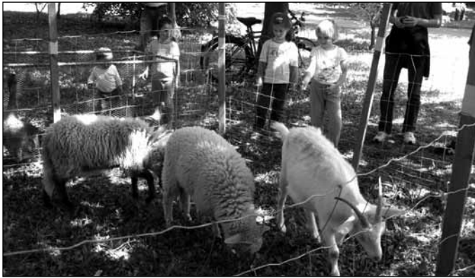
A nagyszerű Big Horn Ranch állatsimogatója a Majálison