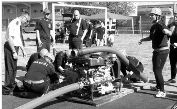
Versenyre készülnek a somorjai lányok

miután Ürge Lajos parancsnoktól átvette a jelentést. Az időjárás kiváló volt az egész nap folyamán, a rendezvény lebonyolítása is gördülékenyen folyt, lényeges szervezési vagy műszaki hibák nem fordultak elő. Minden részt vevő versenyraj a legjobb tudásával és erejével indult