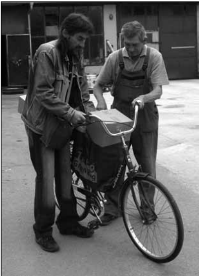
Volt, aki autóba és volt, aki biciklire rakodott

Az Európai Unió által 1987 óta megvalósítandó ételmisszer-támogató programhoz hazánk 2011-ben csatlakozott. E program célja elsősorban az, hogy segítséget nyújtson a szűkös anyagi