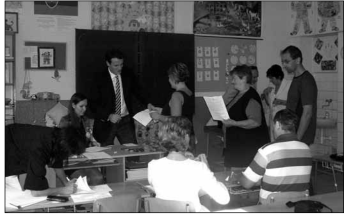
Az ösztöndíjak átadása Tejfalun...

Szeptember 28-án vette át a Rákóczi Szövetség ösztöndíját az a 156 somorjai és környékbeli szülő, akik a 2011 szeptemberében kezdődő tanévben magyar alapiskolába írták gyermeküket.