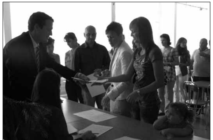
... és Somorján

családjuk körében is, hogy a jövőben még több elsős részesülhessen az ösztöndíjban. Egyszeri támogatásról, jelképes összegről, de annál nagyobb szeretettel adott pénzről van szó, hiszen az ösztöndíjalap magyarországi civil szervezetek, önkor-