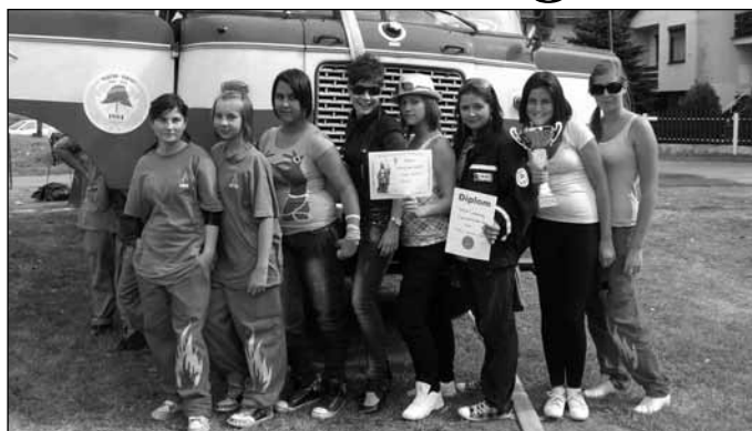
A győztes tejfalui lánycsapat