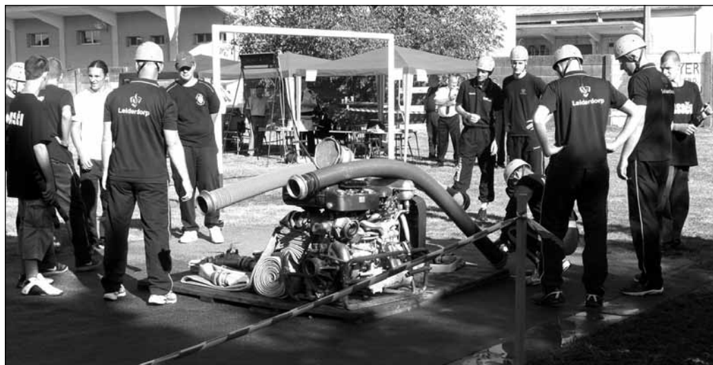
Hostia z Leiderdorp v akcii

ných technických a organizačných ťažkostí a všetky súťažné družstvá sa snažili dosiahnuť čo najlepší čas. Šamorínskym hasičom v kategórii mužov o vlások uniklo tretie miesto, ktoré si držali takmer do konca súťaže. Prvú priečku tento rok dosiahli muži z neďalekej Kyselice. V kategórii žien to dopadlo úplne ideálne, keďže naše dievčatá získali prvé miesto. Veľkú pozornosť priťahol aj požiarňu útok holandského družstva z Leiderdorp, ktorí sa už druhý-