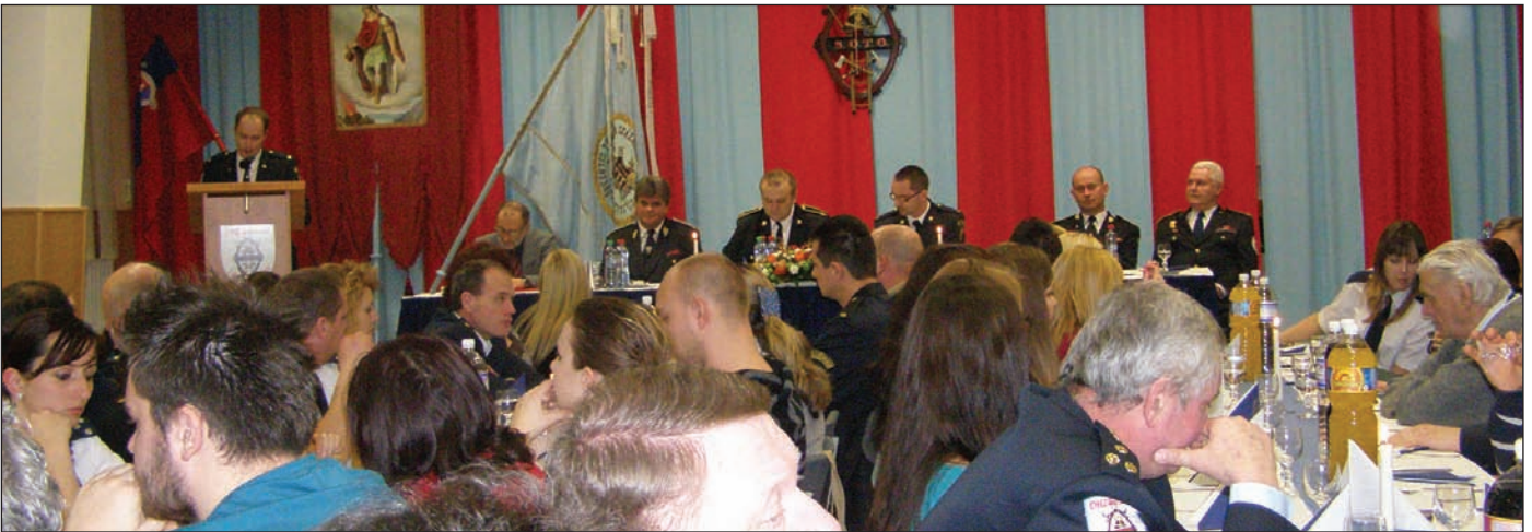
Százharmincyolcadik működési évét értékelte évzáró taggyűlésén a Somorjai Önkéntes Tűzoltó Testület. Írásunk a 7. oldalon