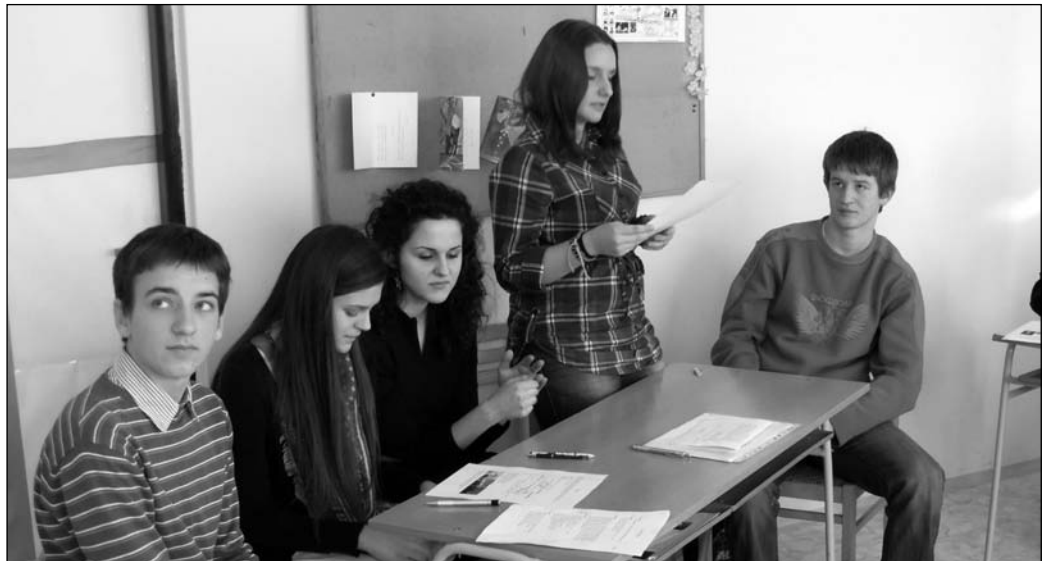
A somorjai csapat