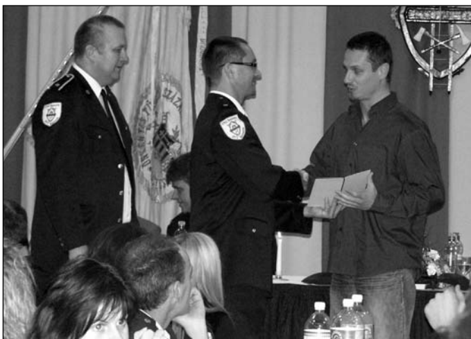
Köszönőlevelek átadására is sor került

Telefonszám: 562 21 71 vagy 0907 442 030