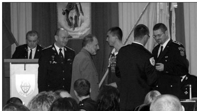
A rangemlékek sem maradtak el

sportot, kultúrát, felkészülést, művelődést, oktatást, kiképzést stb. vázolta a tavalyi tevékenységet. Kitért a szertár felújítási munkálataira is, megemlítve mindazokat, akik egy kicsivel is hozzájárultak ahhoz, hogy 2011. december 10-én ünnepélyesen átadásra kerülhessen