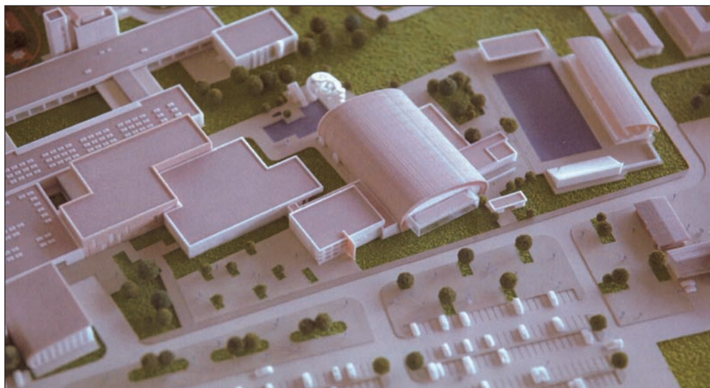
Az aquaaréna látványterve

Az építkezési engedélyek megszerzését követően az aquaarénát három éven belül meg kell építeni Csölösztön