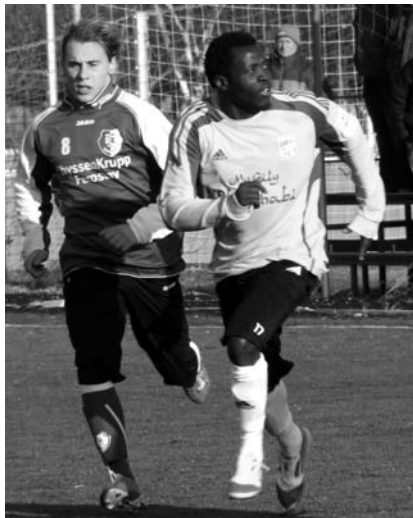
A felvétel a tavaszi idényre való felkészülés barátságos mérkőzésén (DAC-Somorja) készült.