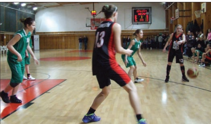
Extraligás női kosarasaink nem vallottak szégyent a kassai Good Angels csapatával hazai pályán játszott mérkőzés során sem. A mérkőzés szünetében az ificsapat szórakoztatta a szépszámú közönséget