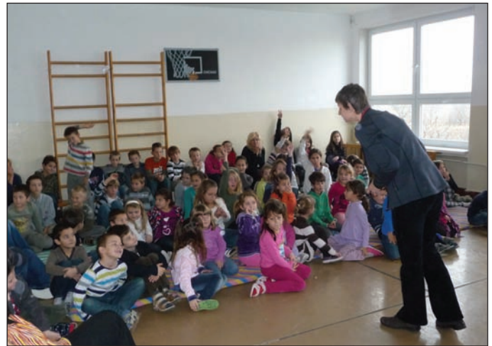
Projekt „Žiačik Separáčik“ je realizovaný spoločnosťou AVE na základných školách a jeho úlohou je vysvetliť najmenším „producentom“ odpadu, ako funguje systém separovania odpadu a jeho dôležitosť pre zdravú spoločnosť. Viac na strane 7.