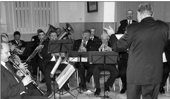
Účastníkov výročnej členskej schôdzi vítala dychová hudba

ny hasičský zbor má 109 členov, teda skoro na každého člena pripadal jeden zásah. Výročná správa komplexne zhodnotila život hasičov v