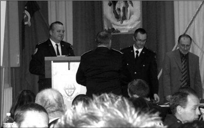
Na výročnej schôdzi sa povyšovalo a odovzdávali sa ďakovné listiny

Dobrovoľný hasičský zbor v Šamoríne hodnotil na výročnej členskej schôdzi 138. rok svojej činnosti. Schôdza sa konala v rokovej miestnosti obnovenej hasičskej zbrojnice.