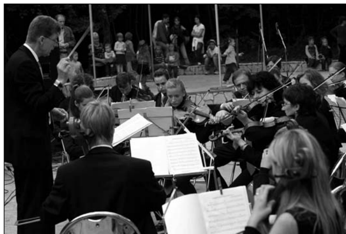
Vystúpenie medzinárodného mládežníckeho orchestra v Pomlé

Cudzí jazyk a metódy nového dirigenta prinášali často