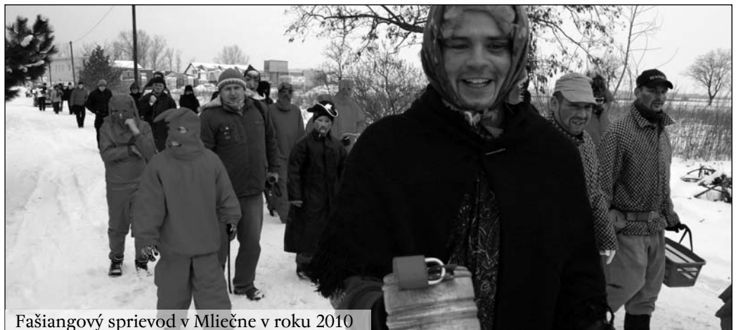
Fašiangový sprievod v Mliečne v roku 2010

ktorý v Mliečne organizuje miestny Dobrovoľný hasičský zbor, sa bude konať 18. februára 2012 . Veselý svadobný sprievod sa do ulíc vydá spred hasičskej zbrojnice o 9.00 hod. a následne prejde celou dedinou. Organizátori všetkých srdečne pozývajú!