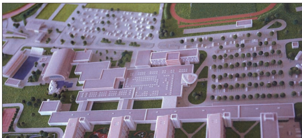
Vizualizácia časti športovo-rekreačného areálu v Čilistove