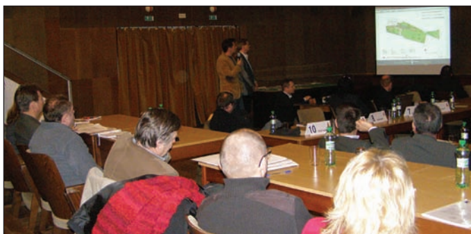
Zástupcovia Istrokapitál Slovensko, a.s. predstavili svoje plány