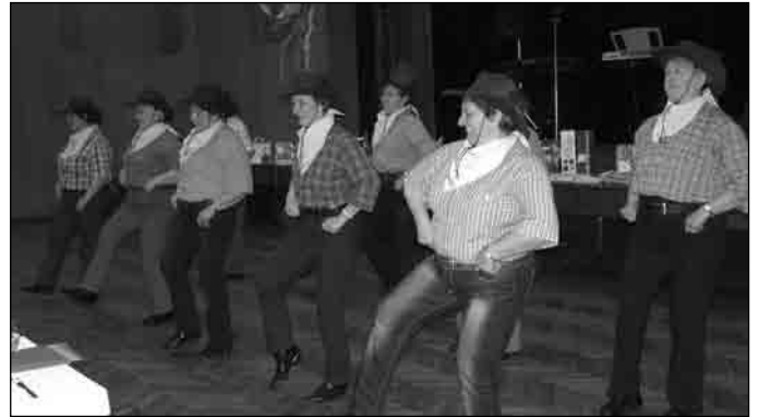
A jó hangulatot a mosonmagyaróvári Margaréta Nyugdíjasklub tagjainak tánca adta meg