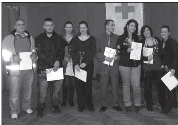
Členovia družstva prvej pomoci

Zo správy sme sa dozvedeli aj to, že miestny Červený kríž pomáhal aj družstvám slovenskej základnej školy, maďarského a slovenského gymnázia pri príprave na súťaž v poskytovaní prvej pomoci. Organizácia pokladá za svoju najdôležitejšiu úlohu organizáciu pravidelných darovaní krvi. V tejto oblasti už niekoľko rokov spolupracuje s bratislavskou Národnou transfúznou službou, vďaka čomu darcovia nemusia cestovať, odbery krvi sa pravidelne konajú v mestskom kultúr-