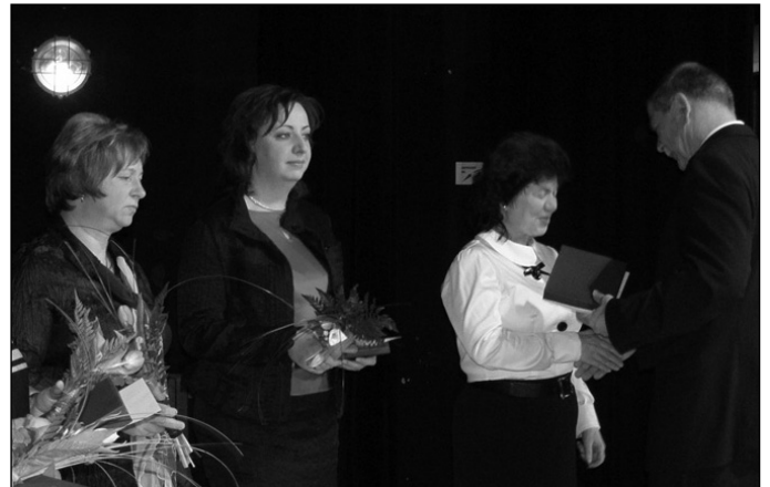
Az elismerésben részesült pedagógusok

hogyan tanulóikat a műveltség megszerzésének helyes útjára vezessék. A pedagógusi pálya nem könnyű, ha kívülről annak látszik is. A szakma nagyobb megbecsülést érdemelne a társadalom részéről, hiszen elsősorban a pedagógus feladata az, hogy a rábízott gyermekekből kiváló tulajdonságokkal rendelkező személyiségeket és