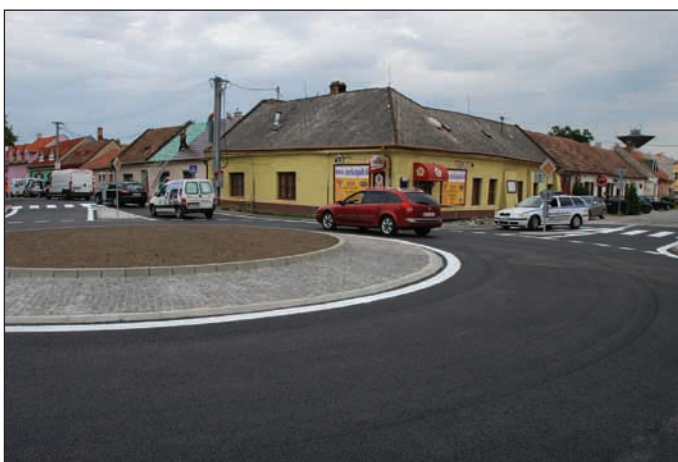
A körforgalmon áthaladó első gépjárművek

szült. A munkálatok július közepén kezdődtek, befejezésüket az iskolakezdés időpontjára tervezték. A beruházó (a város önkormányzata) és a kivitelező jó együttműködésének köszönhetően a körforgalom szeptember 1-jére elkészült, reméljük, mindenki meglepésére.