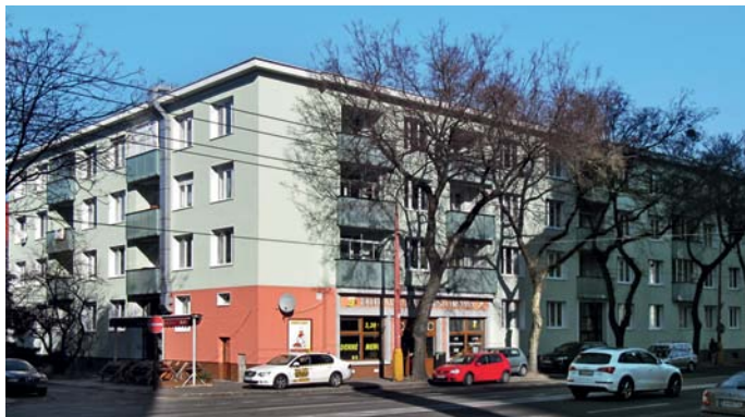
Najlepšie obnovený bytový dom roku 2011 – Liptovská 42, 44, Prievozská 19, 21, Zvolenská 2, 2A, Bratislava

Spoločnosť PS STAVBY sa vďaka kontinuálnemu a systematickému rozvoju vypracovala na slovenskom trhu medzi najúspešnejšie stavebné spoločnosti špecializujúce sa na komplexnú obnovu budov. Tlak na ceny zo strany investorov ako aj vnímavý prístup k ich požiadavkám nás doviedol k integrácii nových činností a vytvoreniu pestrej palety riešení vedúcich ku komplexnej obnove objektov bytovej výstavby.