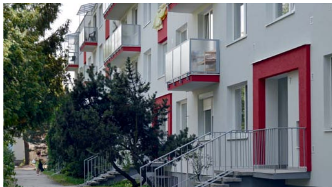
Obnovený bytový dom na Veľkomoravskej v Malackách

Priebeh prác na našich stavbách podlieha systému nezávislej kontroly a navyše je interne riadený v zmysle systému manažérstva kvality ISO 9001:2008. K zvýšeniu kvality bývania patrí aj ekologický aspekt, preto sme sa rozhodli symbolicky prispieť Zeleným šekom všetkým, ktorí sa nás rozhodnú v tejto iniciatíve podporiť – stačí si iba vyžiadať ponuku. Každoročne rozširujeme naše kompetencie o nové licencie a certifikáty, získavame