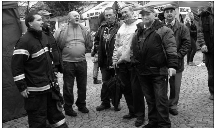
Naši hasiči na jarmoku