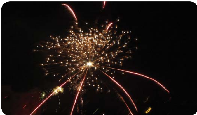
A polgármester újrólévi üdvözlését követően a csodálatos tűzijátéknak köszönhetően fényárba borult az égbolt városunk felett.

Elhangzott 2013 első órájában, a polgármesteri hivatal ablakából