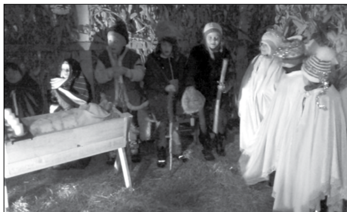
Tejfalu december 19-én sokan megtekintették az élő Betlehemet...