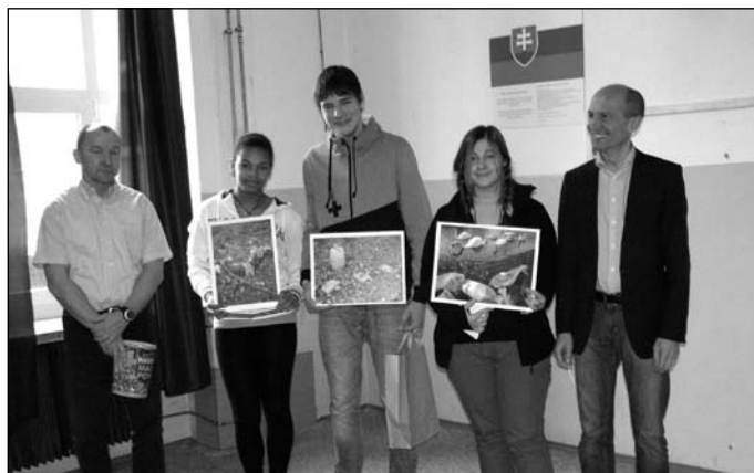
Vítazi zo Základnej školy Mateja Bela v Šamoríne

Na Základnej škole Mateja Bela, ktorá má 965 žiakov, sa