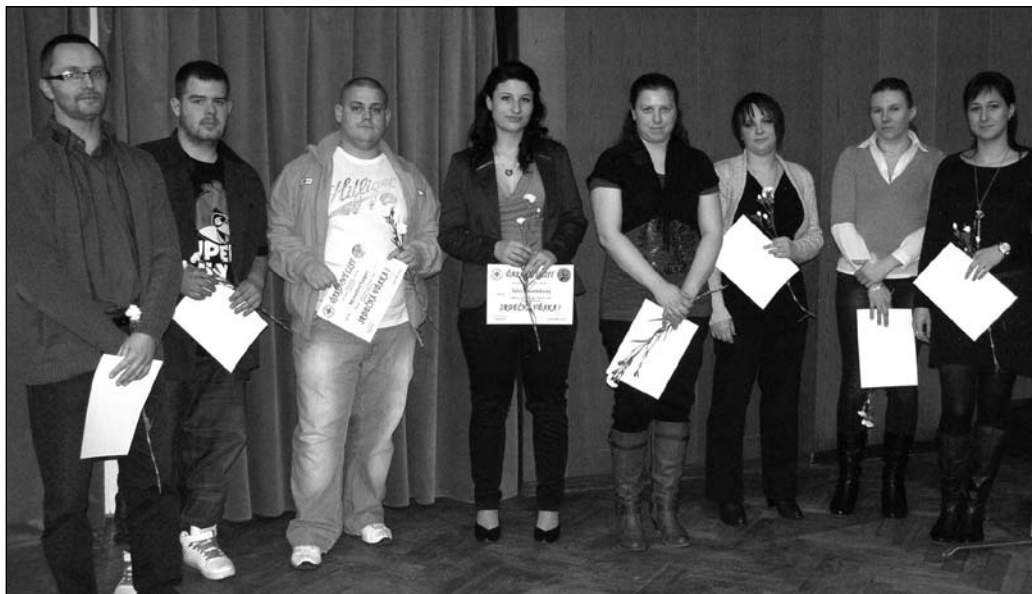
Členovia družstva prvej pomoci