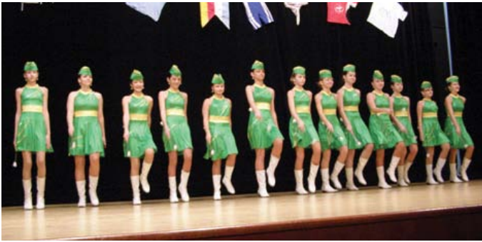
Mažoretky ZŠ Mateja Bela na športovej gale. Viaczej na strane 11