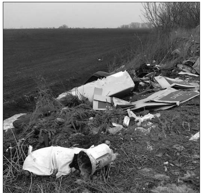
Nelegálny odpad – Veľká Paka

li, že aj oni sa až po dlhých rokoch dôslednej práce dopracovali k recyklácii veľkej časti odpadu. Verme, že aj my budeme v budúcnosti venovať väčšiu pozornosť separácii odpadu, aby sme tak chránili naše životné prostredie. Na Žitnom ostrove je to veľmi dôležité aj kvôli významnej zásobárni pitnej vody. (ti)