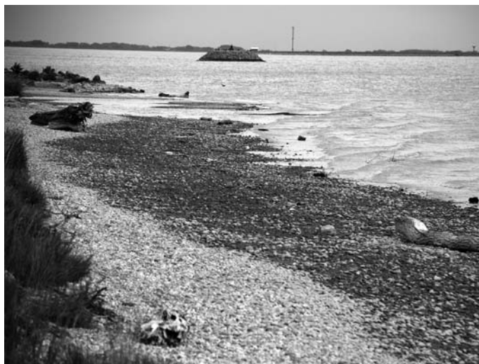
Azért a víz az úr...