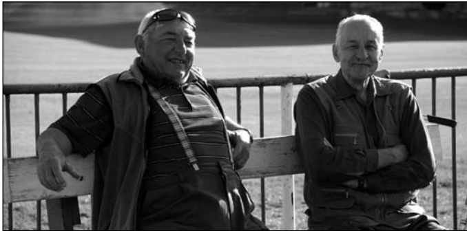
Fanuškovia ŠTK sledujú aj tréningy s veľkým záujmom...