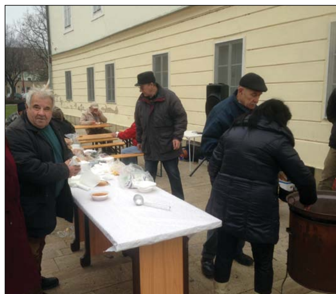
Poslanci mestského zastupiteľstva 28. decembra rozdávali koncoročnú kapustnicu na Hlavnom námestí