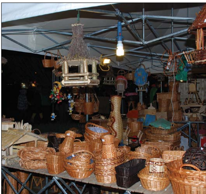
Vianočné trhy 2013 na Hlavnom námestí mesta