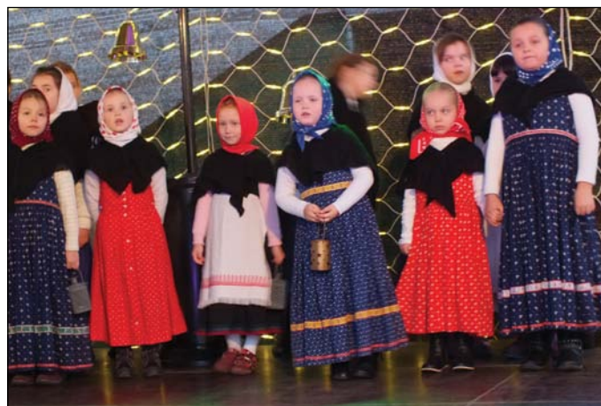
Detský folklórny súbor Prvosienka vystúpil aj na vianočných trhoch v Čilistove pri Hoteli Kormorán.