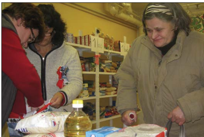
OZ Ain Karim zorganizovalo v predvianočnom čase už po ôsmykrát aktivitu pod názvom 3R – Radosť Rozdávaním Rastie. Viac na strane 4.