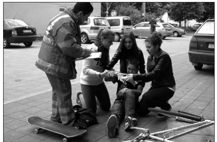
Simulácia nehody. Úlohou súťažného družstva je poskytnúť prvú pomoc