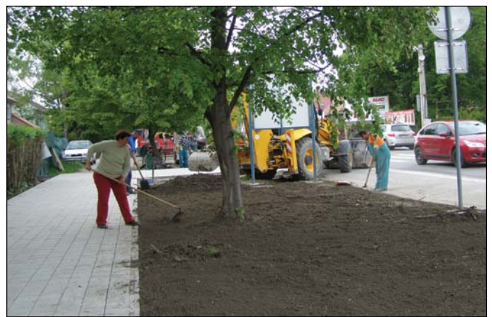
Tereprendezés a Pozsonyi úton

az úttest mindkét oldalát, és karbantartásuk is egyszerű. Másfél éven keresztül a város több pontján különféle gyártóktól származó, más és más típusú lámpák kerültek kipróbálásra, hogy a valóságban is érzékelhető legyen a fényerősségük, energiaigényük és kezelhetőségük. Sok esetben kikértük a környéken lakók véleményét is. A város által meghirdetett versenytárgyalás nyertese Schreder Nano, Tecceo és Kio típusú lámpákat szerel fel a városban. A lámpacserével a közvilágítás eddigi 600 – 610 ezer kWó éves energiafogyasztása 145 – 150 ezer kWó-ra csökken, ami 70 százalék körüli energiamegtakarítást eredményez. Természetesen ezzel arányosan csökken az energiafogyasztásra fordított pénzösszeg is. A beruházás ára 558 ezer euró, ez az összeg azonban nem terheli a város költségvetését, mivel kilenc éven keresztül az energiamegtakarítás árából fogjuk téríteni. A további években a megtakarítás összege megmarad a város kasszájában. Az egész beruházás legnagyobb hozadéka a jelentős energiamegtakarítás és ezáltal a környezetvédelem. A mostani beruházást folytatni