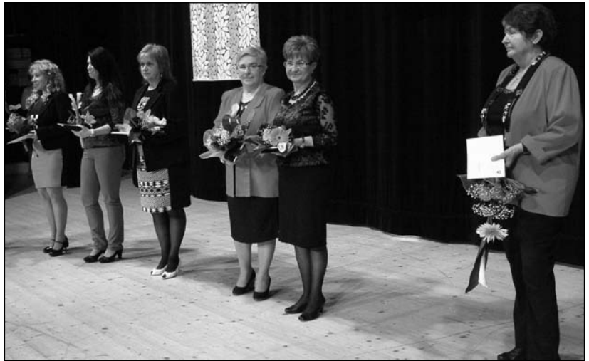
A kitüntetett pedagógusok

re megmarad emlékeinkben. „Örülök annak, hogy a nyugalmazott tanítóink is rendszeresen eljönnek közénk, hiszen ők is, tevékeny pedagógusainkkal együtt, városunk nagy pedagóguscsaládját alkotják. Sokan közülük a jelenleg iskolalapadjainkban ülő gyerekek szüleinek, sőt nagyszüleinek kezdeti lépéseit egyengették” – jegyezte meg a polgármester. A pedagógus munkája nincs kellőképpen értékelve. Ideje lenne, ha a mindenkori kormányok tudatosítanák, hogy a műveltségre fordított összeg a legjobb befektetés. A gyermek kincs, s mindenképpen