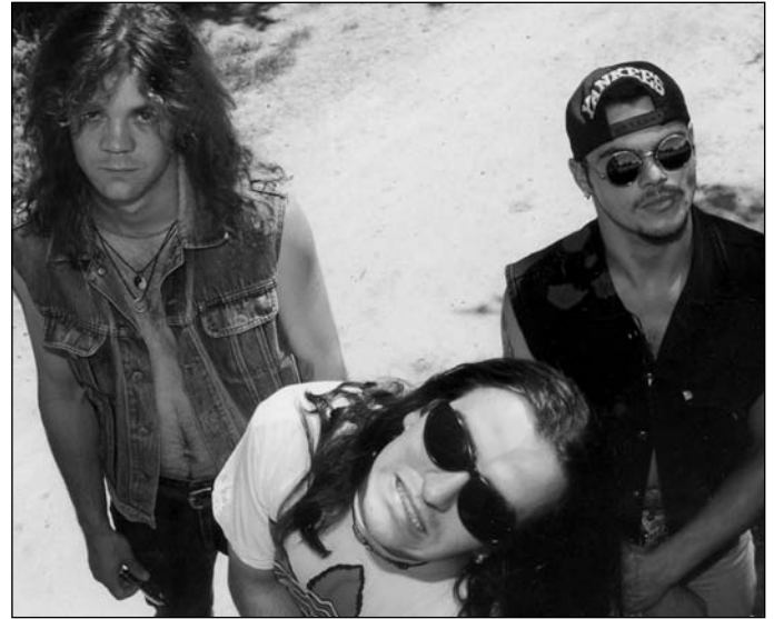
Sancho, Koppány a Püke – 1997

Odvtedy sa môžeme opierať o oficiálnu webovú stránku kapely: V roku 1999 vyšiel prvý album skupiny Kettőre