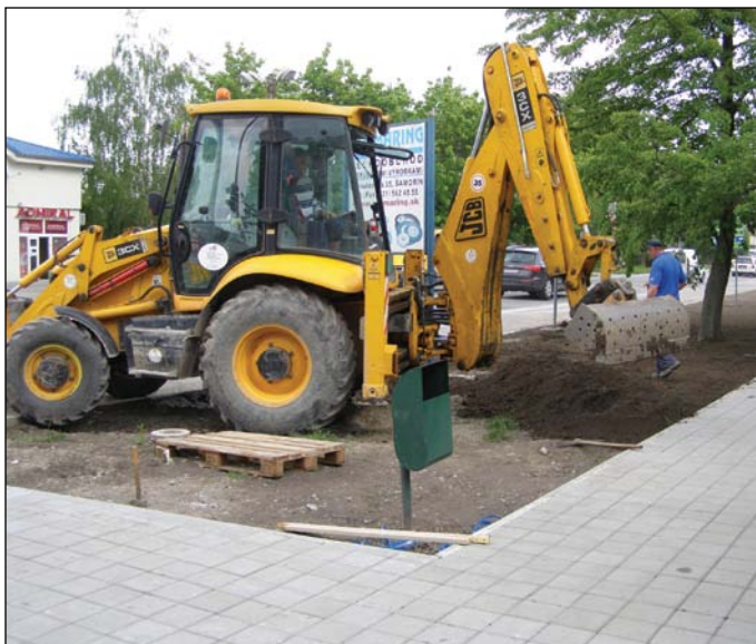
Terénne úpravy na Bratislavskej ceste