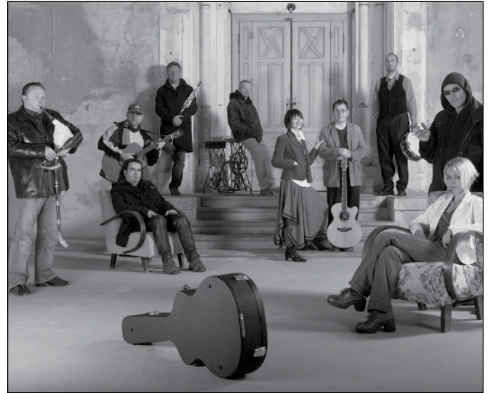
Samaria Verses Band