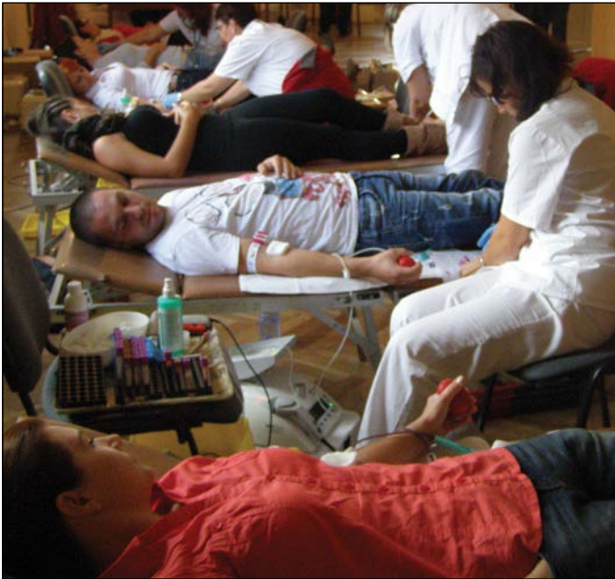
22. septembra prišlo darovať krv vyše päťdesiat darcov. Viac na strane 7.