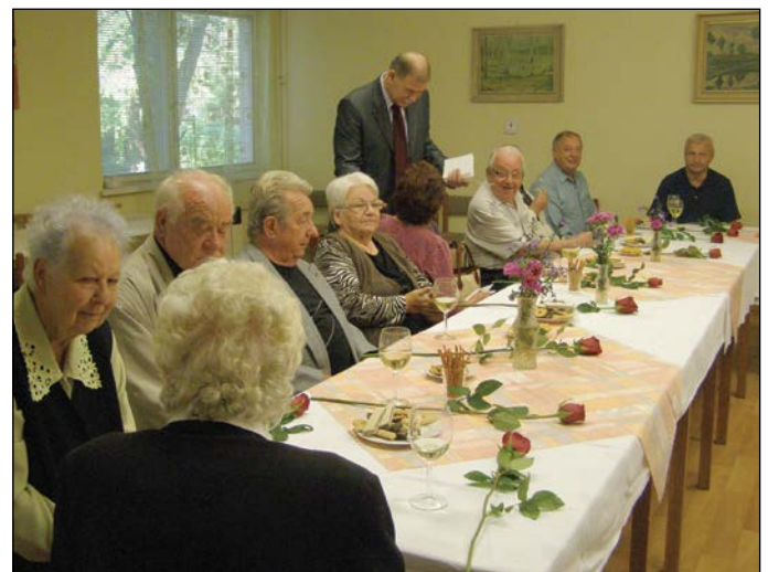
V predposledný septembrový deň funkcionári mesta zablahoželali tým našim spoluobčanom, ktorí v septembri oslávili 70., 75., 80., 85. a vyššie narodeniny.

22. novembra 2014 MsKS Šamorín Najhranejší francúzsky autor na svete Marc Camoletti je späť! Na nedávny megaúspech inscenácie „Kto zhasol svetlo“, nadväzuje nemenej vtipná a bláznivá komédia o peripetiách rozpadu manželstva. On advokát, ona lekárka - zdanlivo poľahky sa mienia vzdáť svojho celoživotného partnera. Nie však svojej polovice domu. A čo ešte keď sa v obývačke objavia aj milenci oboch. Francúzi to majú za takýchto okolností ľahšie než Slováci: aj tentoraz im situáciu pomáha rozuzliť majordómus a sluha v jednej osobe - charizmatičký, jasnozrivý a prostoreký Viktor. Už dávno ste sa toľko nenasmiali, ako zaručene na tejto fraške, kde plieskajú facky aj dvere, padajú obvinenia aj zábrany a víťazí všeobjímajúci humor. Nenechajte si ujsť skvelé výkony Vašich obľúbených hercov.