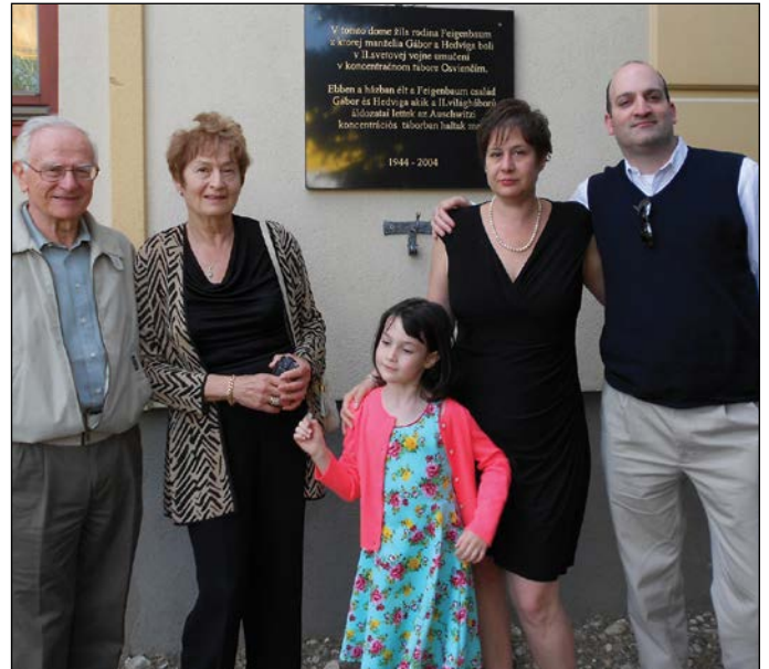
V druhej polovici júna sa udiali dve spomienky pri príležitosti 70. výročia deportácií židovského obyvateľstva z nášho územia. Viac na strane 9.