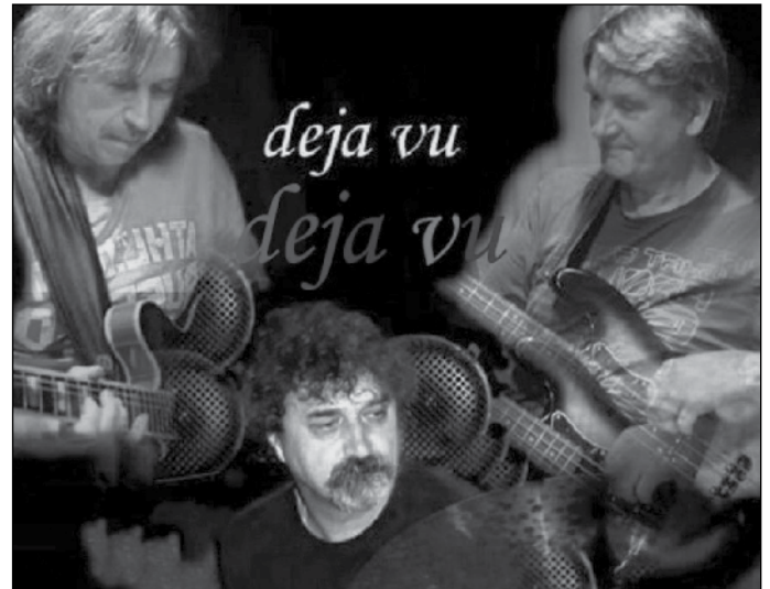
Deja vu 2014

A Deja vu ténykedéséhez három nagyobb projekt kapcsolható. Az egyik a Koffer galéria volt, két vándorkiállítás szerveztünk. A Jazz-foto