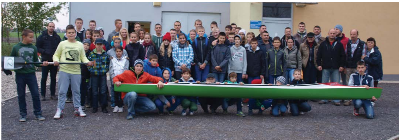
A KCK Somorjajati sportolói az idén is megnyerték a Szlovák Kajak-kenu Szövetség által meghirdetett pontozásos versenyt, a Szlovákia-kupát. Írásunk a 11. oldalon