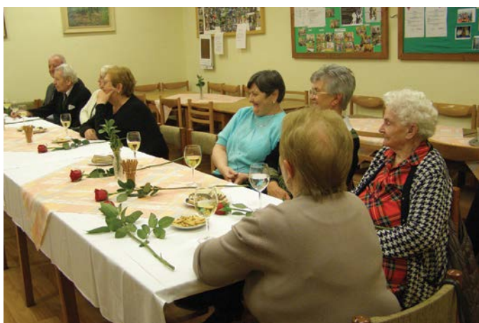
Városunk vezetősége az elmúlt hónapban is felköszöntötte azokat a polgártársainkat, akik októberben töltötték be 70., 75., 80., 85. és ennél több életévüket.