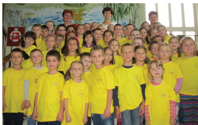
„Az Úr 2014. esztendejében, október havának 3. napján” a helyi művelődési központban sor került a Corvin Mátyás Alapiskola elsős diákjainak ünnepélyes felavatására. A szülők és nagyszülők meghatódva nézték csemetéiket. A fogadalomtétel után a kis elsősöket hivatalosan is diákjaink soraiba fogadtuk a végzős osztály tanulóinak közreműködésével. Sok sikert kívánunk nekik a betűk és számok világában!