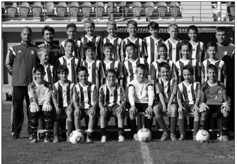
A sikeres U12-esek

A felnőttcsapat a II. ligában az ősz után a tizedik helyen áll, tizennyolc forduló alatt tizennégy pontot szerzett. „Nem vagyok elégedett. Többet vártam. Természetesen tudom, hogy milyenek a klub lehetőségei – kezdte az értékelést Michal Salenka edző. – A gyengébb szereplés okai? Néha hiányoltam a tüzet, a