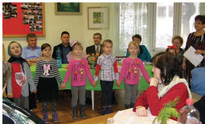
A Duna utcai óvások kedves kultúrműsorral lepték meg a tagokat

városunk polgármesterével folytatott beszélgetés is, mely során a város fejlődését érintő kérdésekről, a hatályos városi rendeletekről és a bennük foglaltak betartásáról (vagy be nem tartásáról) esett szó. Országos szinten működő szervezetről lévén szó a tagoknak megadatik a lehetőség, hogy állami hozzájárulással kirándulhassanak, rekondíciós üdüléseken vehessenek részt. Az alapszervezet él is az adott lehetőséggel, tagjai tavaly Bártfán és Pöstyénben is üdültek. A vezetőség ezeken kívül is szervez egynapos kirándulásokat a közeli tájakra, tavaly