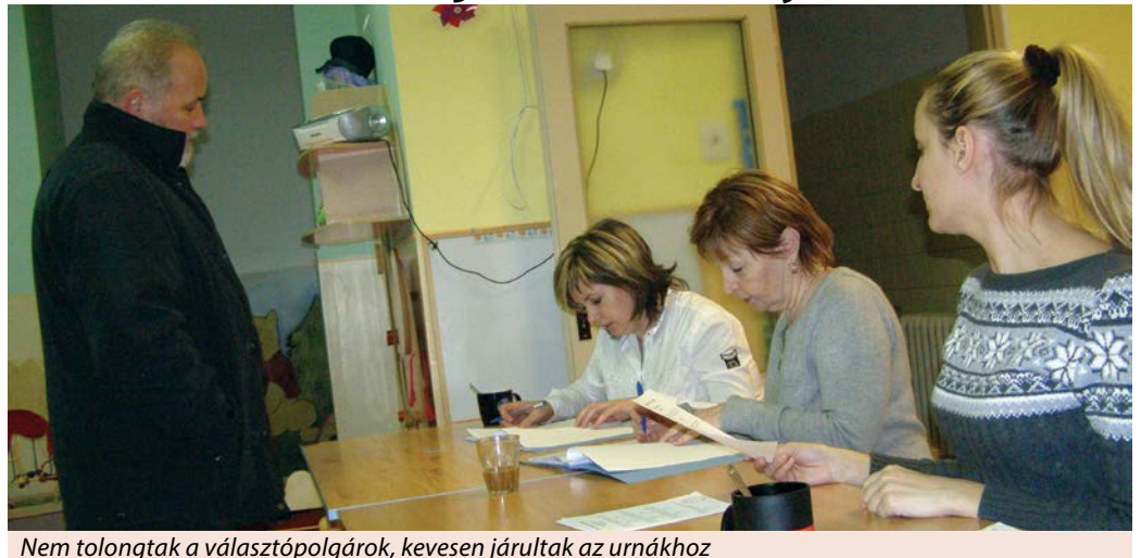
Nem tolongtak a választópolgárok, kevesen járultak az urnákhoz

A referendum során városunk választásra jogosult 10 853 polgára közül mindössze 1226-an vettek részt a család védelméről szóló népszavazáson.