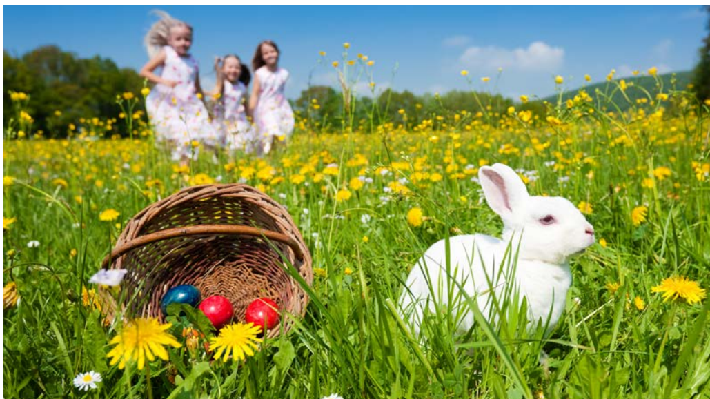
A nagyböjti időszakot a feltámadás ünnepe követi. A közelgő húsvét alkalmából kívánunk minden kedves olvasónknak kellemes ünnepeket.