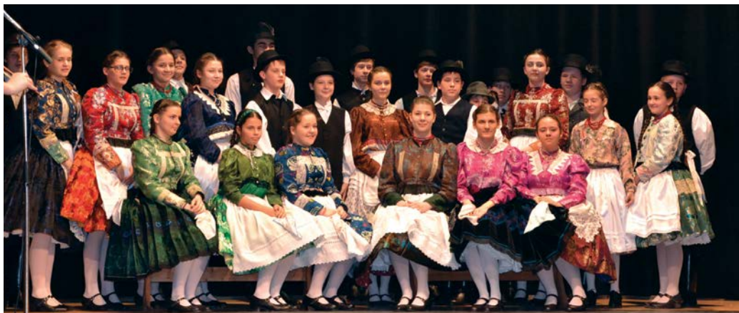
A Nagy Csali táncosai

Már kora reggel óta gyermekzsivajtól volt hangos a kulturális központ. A lányok hosszú copfjaikat fonták (az utolsó verseny óta valóban hosszúra nőtt a hajuk), színes szalagokat kötöttek bele, a fiúk csizmákat, kalapokat próbáltak. Igazán szép népviseleteket öltöttek magukra, amelyek tökéletesen vasaltak, szépen össze-