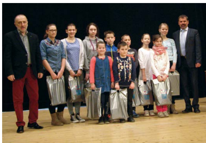
A rajzverseny díjazottjai

a városháza előtt. Az üzem felvonultatta gépparkját, bemutatta műszaki berendezéseit, és az érdeklődők számára lehetőséget nyújtott a víz minőségének kivizsgálására is. A rendezvénynek leginkább az alapiskolák tanulói örültek, akik azon kívül, hogy beülhettek a felvonultatott járművek vezetőfülkéibe, különféle „vizes” versenyekben vehettek részt. Érdekességképpen megje-