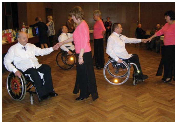
Nagy sikert aratott fellépésével a duna-szerdahelyi kerekesszékesek táncsoportja

A szervezet életében a tavalyi év is tartalmas és sokrétű volt. A város által fenntartott Pomléi úti épületben a keddi és a csütörtöki klubnapokat kihasználva a tagok elbeszélgetnek egymással, megosztják tapasztalataikat, sokszor segítik egymást, ha csak egy jó és bátorító szó erejéig is. Értékesek a már hagyományos rendezvények, mint az egészséges táplálkozás vagy a szív napja, melyek keretében orvosi előadásokra is sor kerül. Közösségépítő