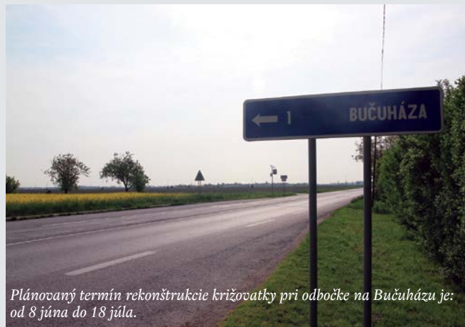
Plánovaný termín rekonštrukcie križovatky pri odbočke na Bučuházu je: od 8 júna do 18 júla.

– Firma prebrala stavenisko 15. apríla a je povinná uskutočniť stavebné práce do 275 dní. Prislúbila však práce ukončiť do konca letných prázdnin. Ako prvá sa obnoví križovatka pri Kraloviankach, nasledovať bude križovatka pri odbočke na Bučuházu a ako posledná sa počas letných prázdnin zrealizuje úplná rekonštrukcia križovatky pri Pomlejskej ulici.