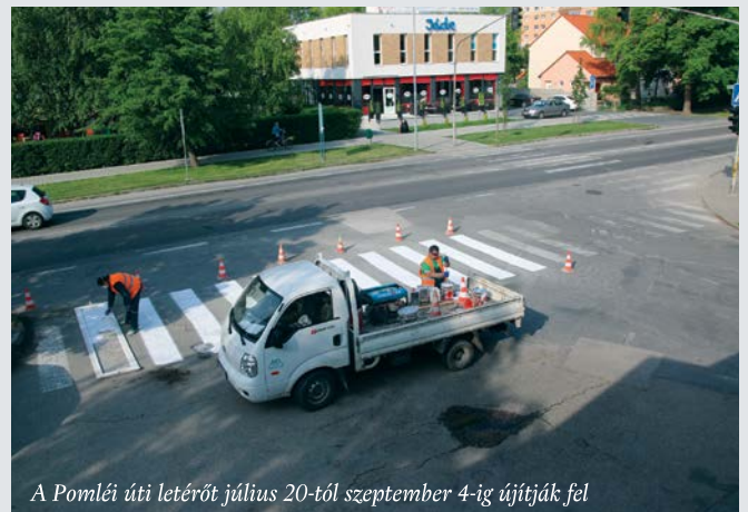
A Pomléi úti letérőt július 20-tól szeptember 4-ig újítják fel

– Az építési terület átadására április 15-én került sor, a kivitelező ettől számítva 275 napon belül köteles elvégezni a munkálatokat. De olyan ígéretet kaptunk, hogy a munkálatokat az új iskolaév megkezdéséig befejezik. Elsőként a királyfiai, majd a bucsuházi útkereszteződést, végül pedig a Pomléi úti letérőt újítják fel.