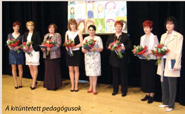
A kitüntetett pedagógusok

„Somorja városa tiszteleg pedagógusainak munkája előtt. Bízunk benne, hogy oktatóink továbbra is nemcsak a tudás fájához vezetik a rájuk bízott gyermekeket, hanem odaadó szeretettel olyan bolygó felé röpitik őket, ahol minden ember jó, boldog, és megértéssel fogadja a másikat.” – Ezekkel a szavakkal köszöntötte Bárdos Gábor polgármester a pedagógusnap alkalmából a város fennhatósága alá tartozó oktatási intézmények pedagógusait. Városunk önkormányzata minden évben megrendezi a pedagógusnapi ünnepséget. A rendezvény idén is az iskolák tanulóinak műsorával vette kezdetét. A hangulaton azonban érződött, hogy a résztvevők többsége az ünnepséget megelőző órákban vett végső búcsút egy szeretett kollégától,