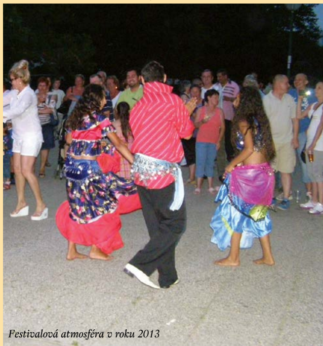
Festivalová atmosféra v roku 2013