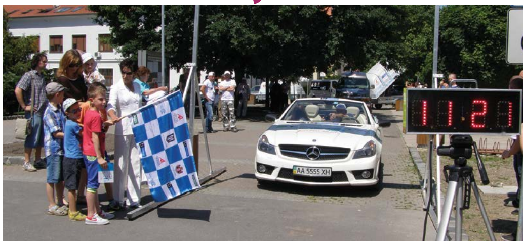
Autá štartovali v dvojminútových intervaloch

Účastníci súťaže, ktorá 3. júna štartovala v Kyjeve a cieľ mala 10. júna v Monte Carle, 6. júna vo večerných hodinách dorazili z Ostravy do športového a rekreačného centra Elements Resort v Čilistove. Súťažiaci tam svoje vozidlá dobili a na druhý deň doobeda na námestí pred radnicou boli vyhlásené výsledky etapy