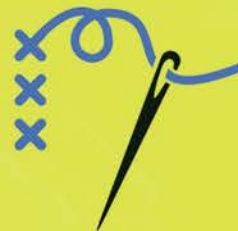
KRAJČÍRSKE ÚPRAVY A OPRAVY