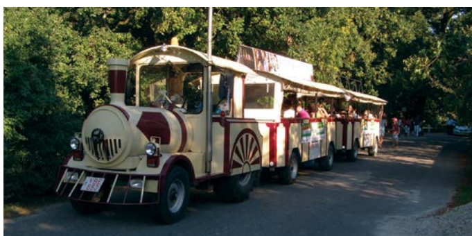
A fesztiválra látogatókat kisvonat szállította a Pomléba és vissza