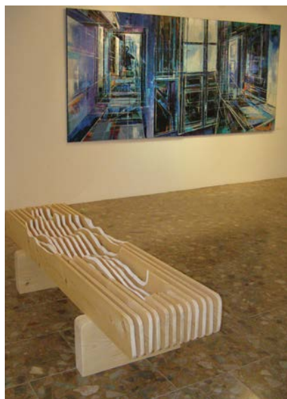
A DunArt.com kiállítása a Tallós-Prohászka István Kiállítóteremben

A Szent István Napok a DunArt.com művésztelep kiállításával kezdődött.