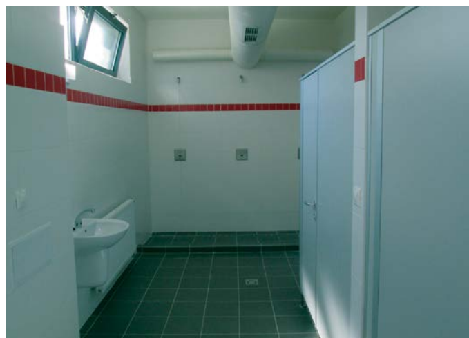
Az öltöző modern, szenzoros zuhanyozókkal