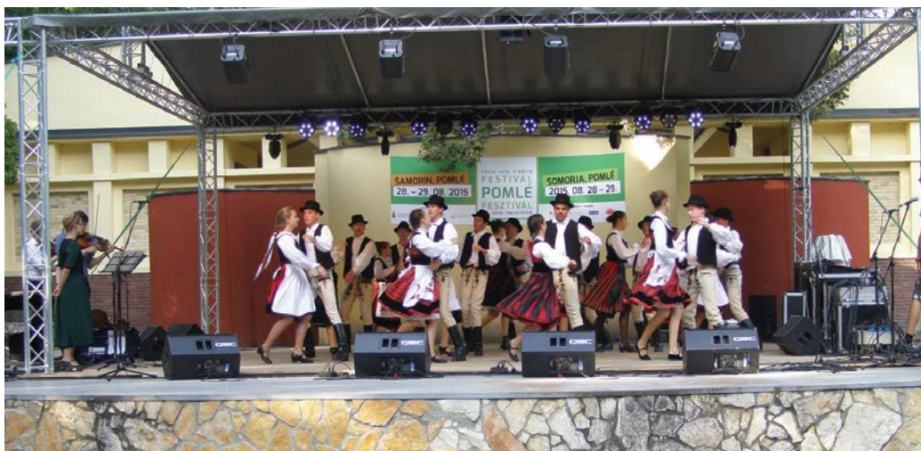
Fergeteges hangulatot teremtett fellépésével testvérvárosunk, Gyergyószentmiklós néptáncgyűttese, a Hóvirág

A szervezők számára pedig a legnagyobb öröm a helyszínek között sétálva látni a sok mosolygó, beszélgető, elégedett embert.