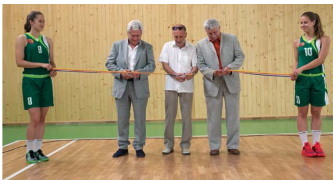
Az ünnepélyes átadás