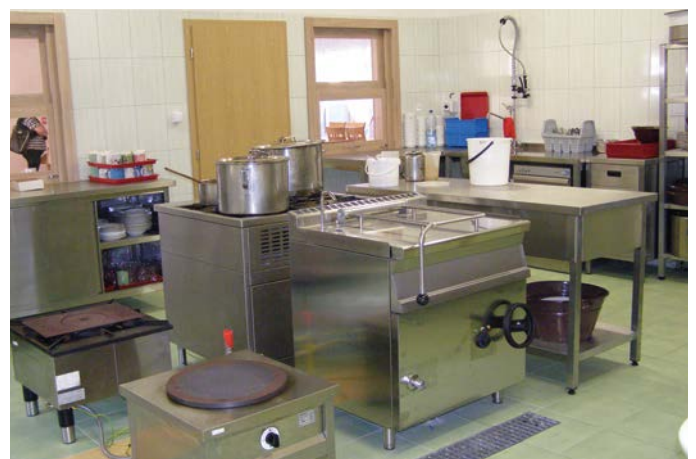
A korszerű konyha