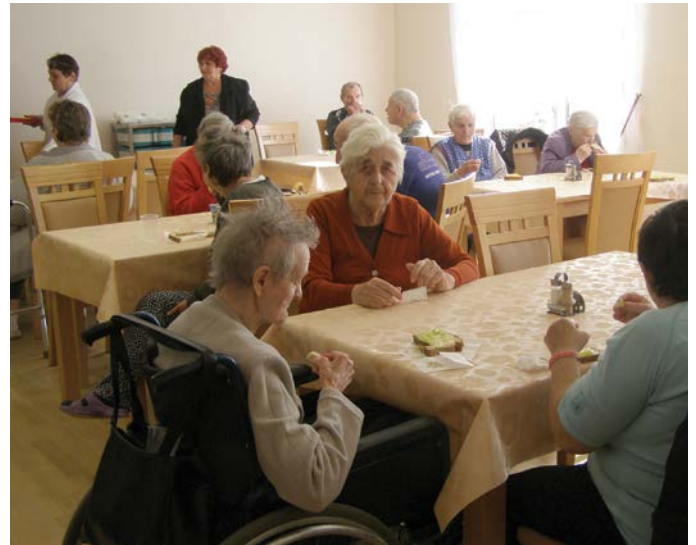
Az első tízórai az új étkezőben