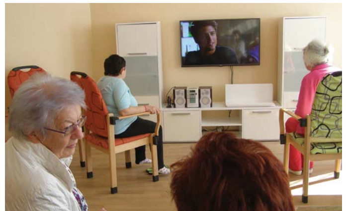
A kényelmes társalgó

Az építés kezdete: 2014. szeptember 21. Az új épület átadása: 2015. szeptember 22. Beruházó: Somorja Város Kivitelező: AREA Somorja Kft. A beruházás tervezett összege: 1 505 000 € A beruházásra fordított összeg: 1 350 000 € Pluszmunkák: kerítés a szomszédok oldalán, berendezés és felszerelés.