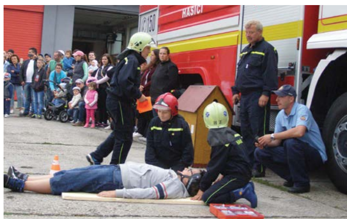
A Profi Team bemutatója

jobb teljesítményt nyújtani. A somorjai csapatok is kitétek magukért: a sport kategóriában a férfiak és a nők is az előkelő második helyen végeztek. A férfiak a klasszikus kategóriában az ötödik helyet szerezték meg, míg a nők sikeresebbeknek bizonyultak ebben a kategóriában: az első helyen végeztek.