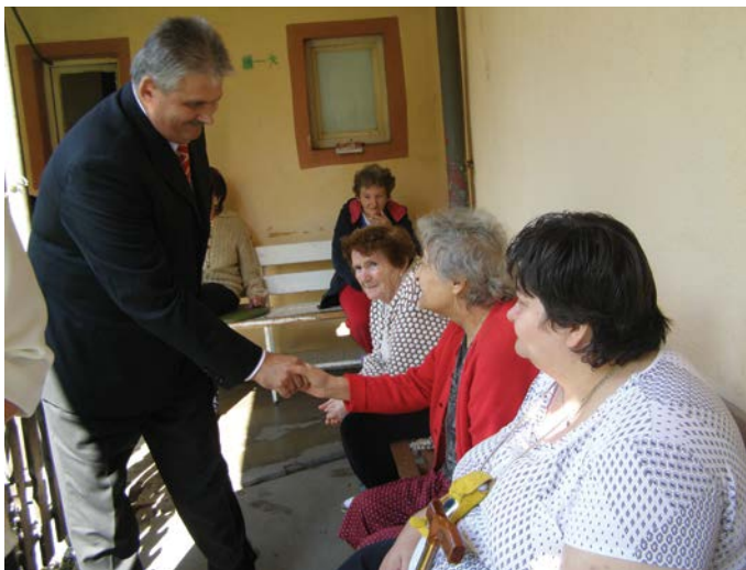
Ján Richter család-, szociális és munkaügyi miniszter az öreg épületben a lakók között