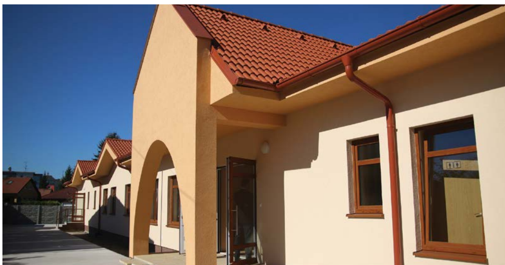
Az új öregotthon bejárati oldala

A képviselő-testület annak idején úgy határozott, hogy a Kaufland bevásárlóközpont alatti ingatlan eladásából származó pénzeszög egy részét az új öregotthon építésére fordítja. A terv elkészült, de megvalósításához a kiválasztott telek kicsinek bizonyult, ezért a város vásárolt hozzá egy telekrészt