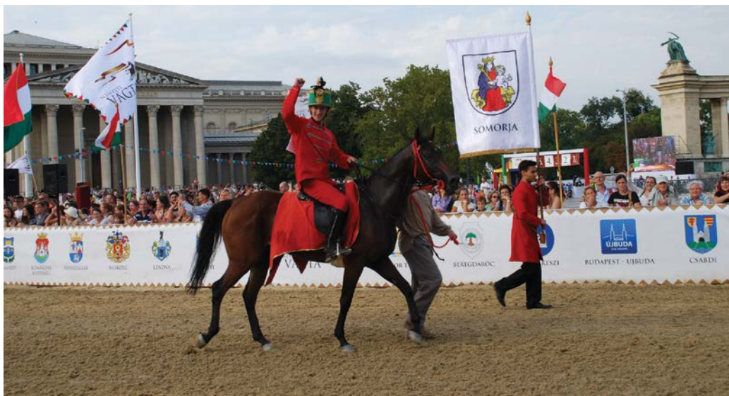
Vankley hátán Egri Árpád

– Egyes lovak már a rajtnál azt csinálhattak, amit akartak, az én lovamnak, Vankleynek azonban semmi nem volt megengedve. Amint próbáltunk tiltakozni, 30 méteres hátrányból kellett indulnunk. A hátrány az egyik dolog. A másik pedig az, hogy akkor indították el a versenyt, amikor lovam még a rajtnak háttal állt, azaz nem voltunk rajtra készek. Az a szomorú, hogy nem csak velem bántak el így... Nemcsak te érezted az igaz-