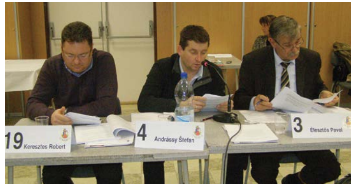
A javasoló bizottság

Ezt követően városunk polgármestere és az alpolgármester beszámolt a képviselőknek a második félévben kifejtett tevékenységéről, majd a számvevőszék által végzett ellenőrzésről elhangzott tájékoztatót követően az önkormányzat jóváhagyta a 12/2015-ös számú, a helyi adókról szóló általánosan kötelező érvényű városi rendeletet (a helyi adókról másutt írunk). Az oktatási törvény módosításából adódóan szükségessé vált az iskolaköteles gyerekek beíratásának helyéről és idejéről szóló városi rendelet elfogadása. Így a 13/2015-ös számú rendelet értelmében az alapiskolai beíratásra április