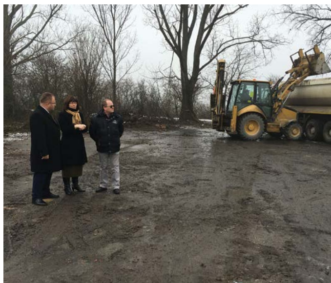
Odstraňovanie nelegálnej skládky v Blatnej na Ostrove