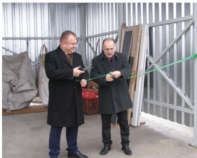
Strihanie pásky na zbernom dvore v mestskej časti Mliečno