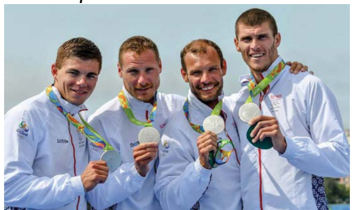
Az olimpiai ezüstérmes kajak négyes