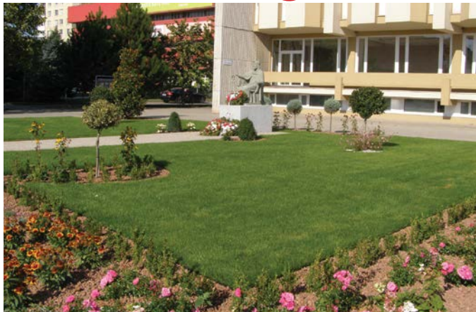
Az idei koszorúzási ünnepség a felújított Szent István téren zajlott

Augusztus 16-án került sor a Csemadok-focikupára a Corvin Mátyás Alapiskola műfüves pályáján, amelyen hat