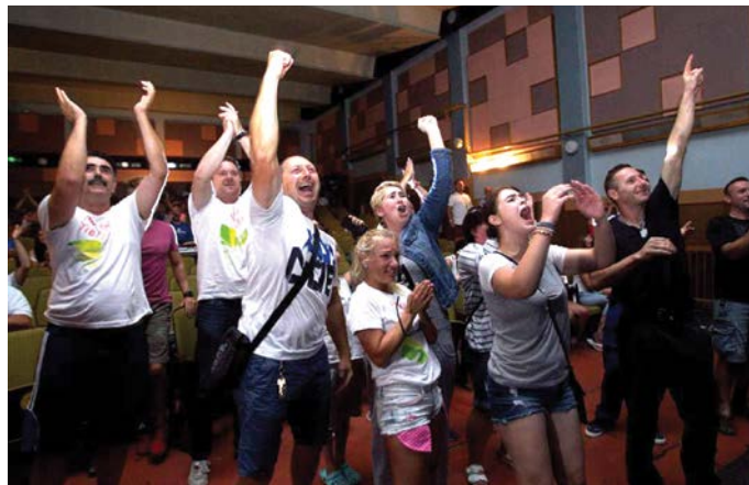
Szurkolás a Mozi Klubban

– Rióba az út kényelmes volt, visszafelé viszont szörnyű. Életem legrosszabb repülőútja volt. Turistaosztályra tettek bennünket, nagyon rossz helyre. De nemcsak én éreztem így. Egy illető hosszabb időre bezárkózott a végébe, mert ott kényelmesen ühelt... Amikor Bécsben beléptünk a váróterembe, földbe gyökerezett a lábam. Nem számítottam rá, hogy eljönnek elém a családtagjaim, a