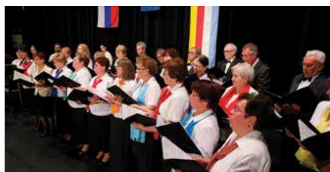
Zmiešaný spevácky zbor Híd