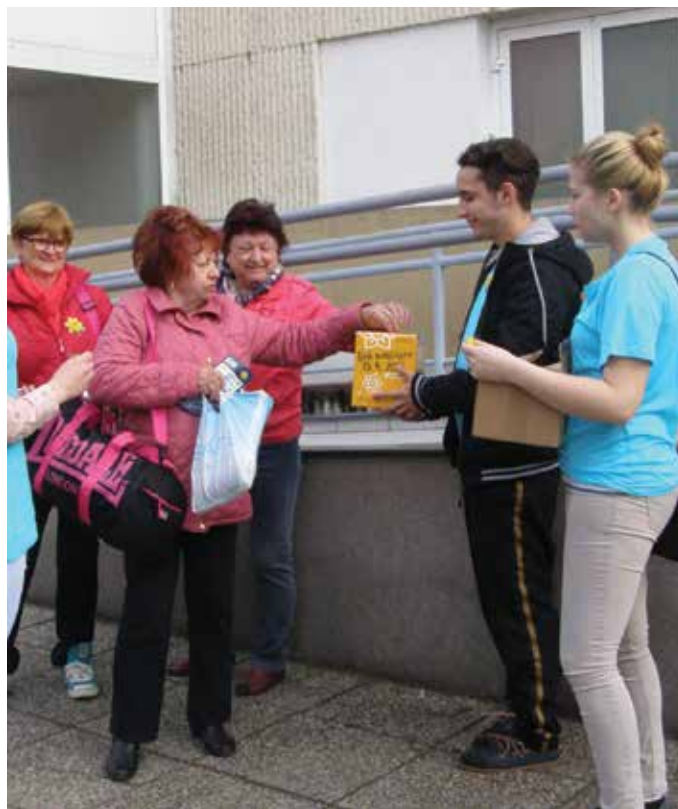
Do zbierky Ligy proti rakovine sa zapojilo viacerých škôl nášho mesta. Snímka Heleny Tóthovej zachytila študentov Súkromnej hotelovej akadémie a Stredného odborného učilišťa SD Jednoty

Ľudia sú všelijakí. Je veľa takých, pre ktorých je piatok trinásteho symbolom nešťastia, je to deň plný obáv a strachu, čože im len tento nešťastný piatok prinesie. Je to však deň ako všetky ostatné. Deň, keď ráno vstaneme a nasadneme do kolotoča bežných povinností. Ak sa nám v tento deň predsa len niečo nepríjemné pritrafí, zvalíme to na dátum a ďalší deň začíname s čistým štítom, bez obáv a strachu – veď piatok trinásteho skončil, máme ho za sebou a s východom slnka sme tak opäť spokojní a usmíati.