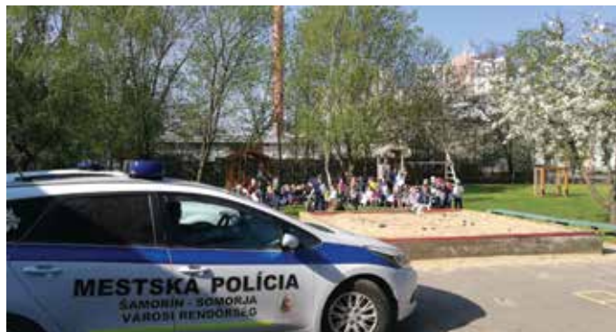
V MŠ na Veternej ulici