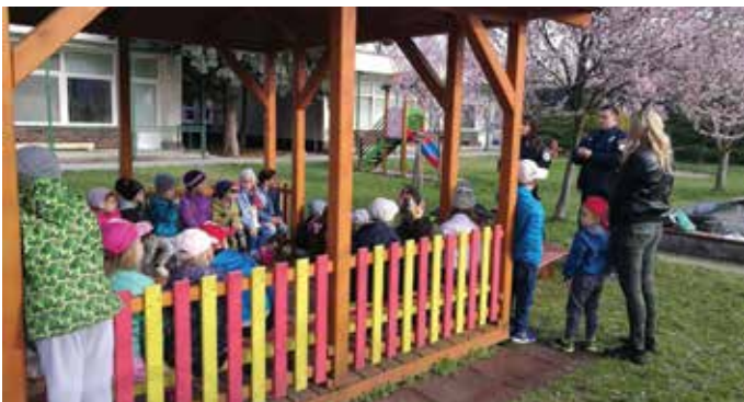
V MŠ ulice Márie