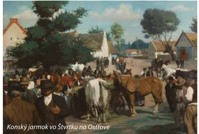
Konský jarmok vo Štvrtku na Ostrove